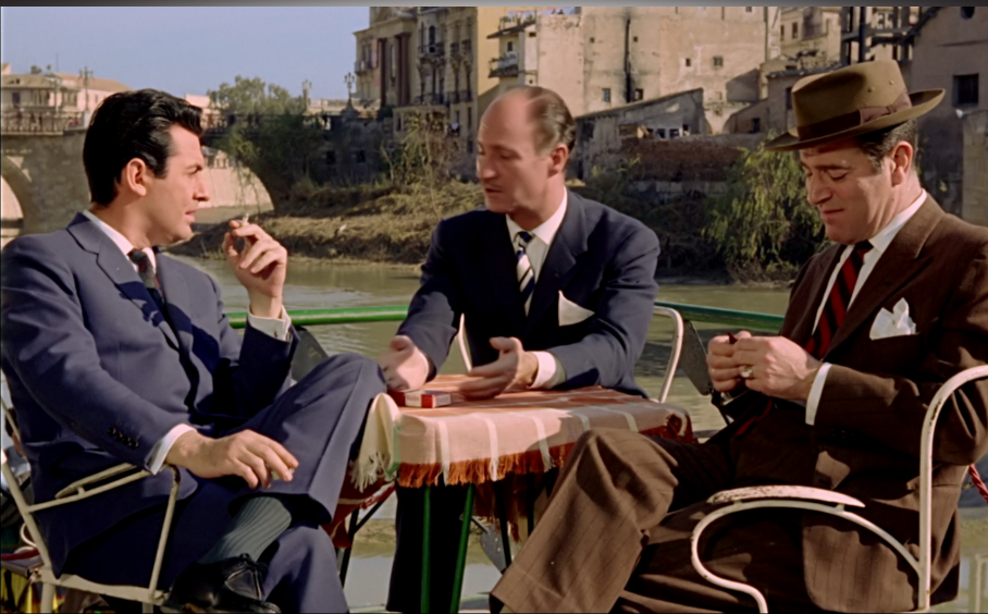
Fotograma de Siempre en mi recuerdo (Silvio F. Balbuena / Manuel Caño, 1962)