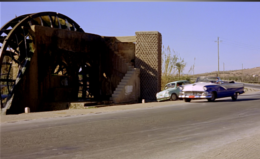
Fotograma de Siempre en mi recuerdo (Silvio F. Balbuena / Manuel Caño, 1962)