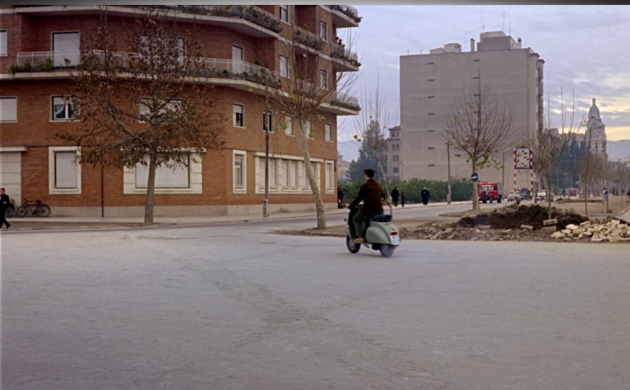
Fotograma de Siempre en mi recuerdo (Silvio F. Balbuena / Manuel Caño, 1962)