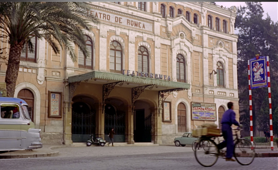
Fotograma de Siempre en mi recuerdo (Silvio F. Balbuena / Manuel Caño, 1962)