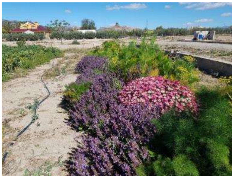
11 de abril, detalle del seto de aromáticas