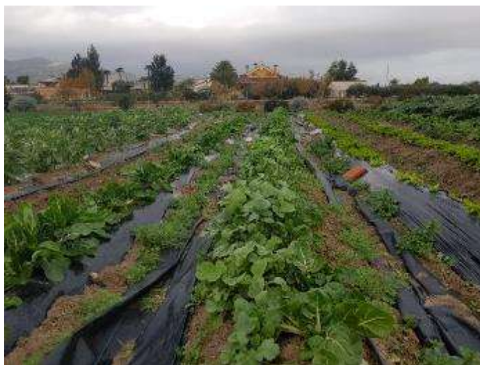
24 de enero (asociación entre rábano y acelga)