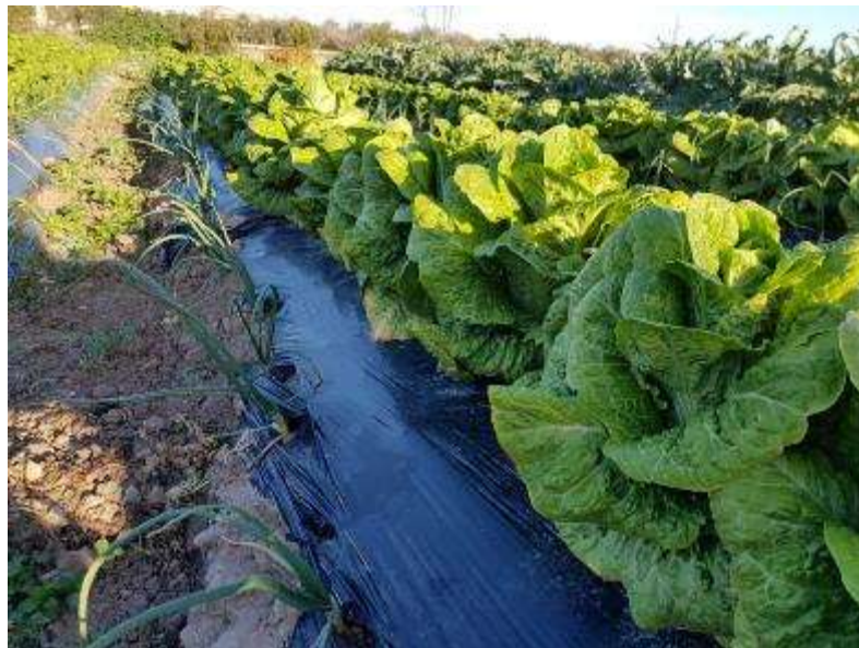
27 de enero (lechuga preparada para el primer corte)