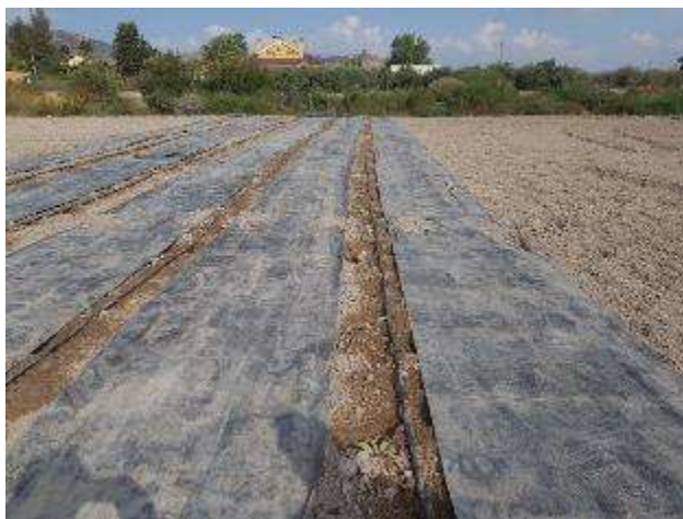
6 de septiembre (colocación de malla geotextil antihierba en la variedad híbrida Lorca)