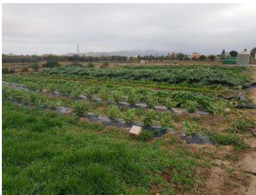
24 de enero. Vista general desde el lado opuesto. (veza y avena en primer plano)