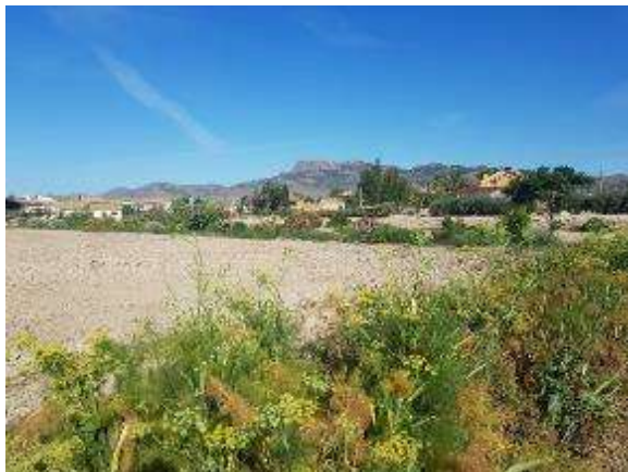
Vista general del seto perimetral como refugio a la espera de que se implante el cultivo (izquierda); Detalle de Lobularias, geranios, higueras, baladre, romero etc)