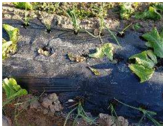
Foto 3 y 4. Asociación de relevo entre lechuga y cebolla (izquierda); primer corte de la lechuga (derecha)