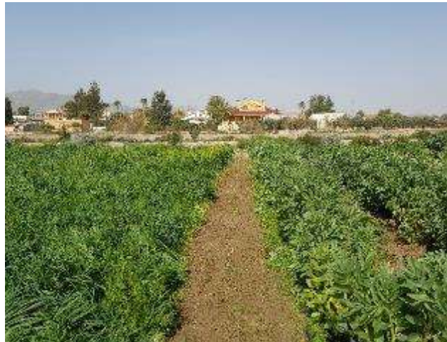
Foto 9 .En esta banda se plantaron las tres macetas de trigo con 500 pulgones presa cada uno para que se extiendan por el cereal y el resto de cultivos