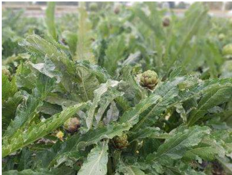
14 de abril. Alcachofa híbrida Lorca.