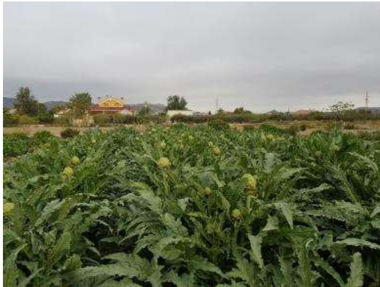
17 de marzo (Blanca de Tudela)