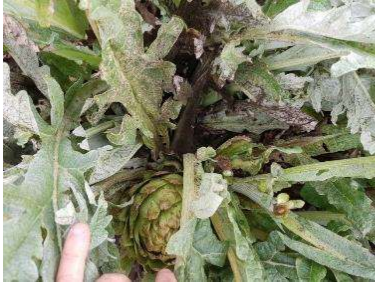
7 febrero. Imagen de foco de pulgón detectado en 1 o 2 plantas