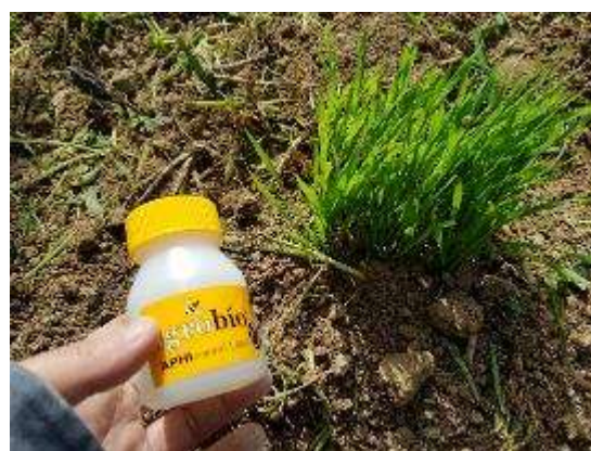
Suelta de Aphidius colemani en habas para control de pulgón (izquierda), en plantas cebo de trigo con presa (derecha) y en el abono verde (veza-avena) que dispone de más cereal donde se habrá expandido también el pulgón-presa. (Fotos 10 y 11) 28 de febrero

Finalmente, también ese mismo día (28 de febrero) se introdujo Phytoseiulus persimilis para control de araña roja repartido entre las alcachofas y las habas. No obstante, no se detectó ningún foco, ni presencia de araña roja.