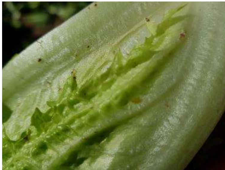
27 de enero. Presencia de pulgón.