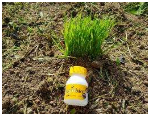
Foto 7 y 8. Cereal de trigo como planta cebo inoculada desde el vivero con 500 pulgones-presa de Rhopalosiphum padi (izquierda)