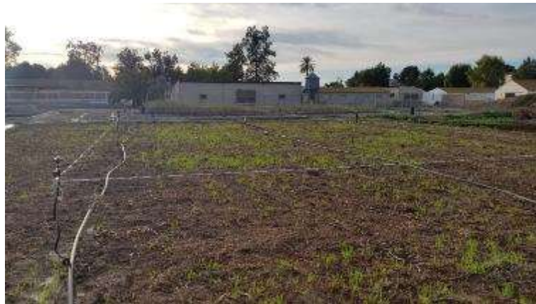
15 de enero. Comienza a crecer la siembra de avena y veza, principalmente avena.