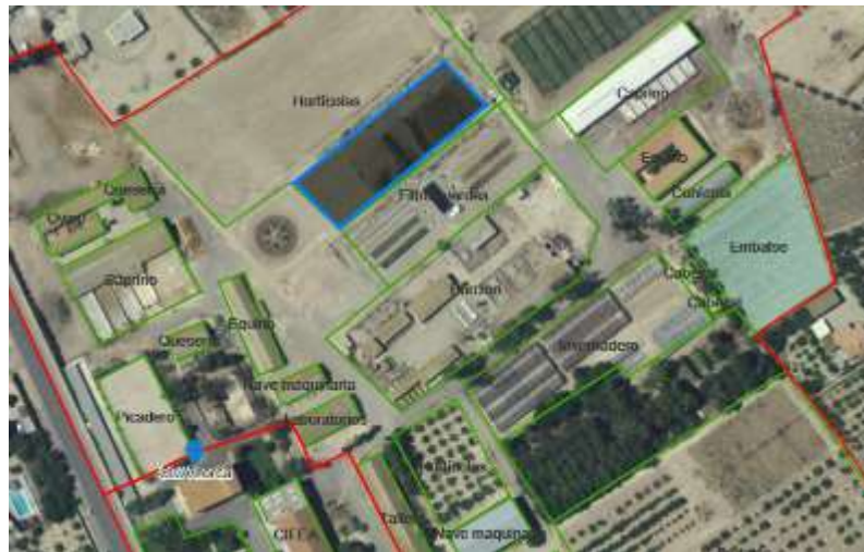
Fig. 1. Situación de la parcela.