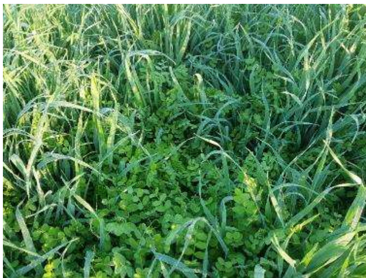
3 de febrero (Detalle de la asociación veza y avena)