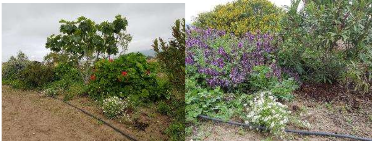
14 de abril., Detalle del seto (higueras, geranios, lobularias, romeros, baladres, etc)