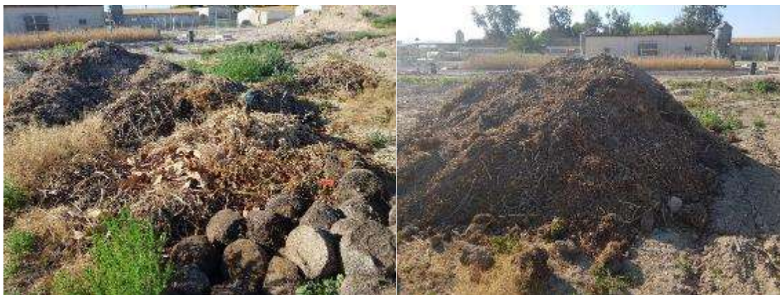
Foto 1 y 2 .Estiércol y restos de cultivos anteriores. Compost en montón de estiércol y restos de cultivo una vez mezclados

Como abono de fondo se ha fertilizado con compost de estiércol maduro de 1 año (mezcla de estiércol y restos de cultivos anteriores principalmente) a una dosis aproximada de 10.000 Kg/hectárea. Esto equivale a unos 1200 kilos de compost en la parcela ecológica.