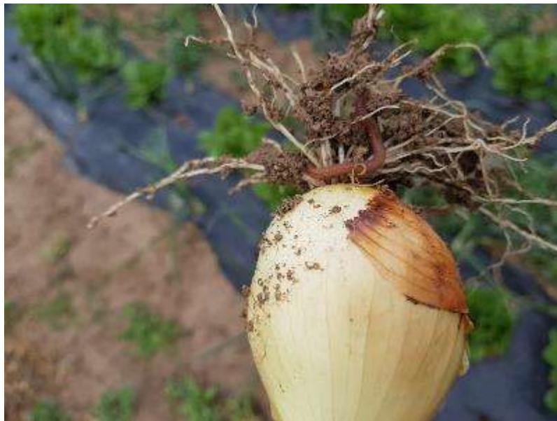
23 de marzo. Cebolla lista para recolectar, detalle de la lombriz