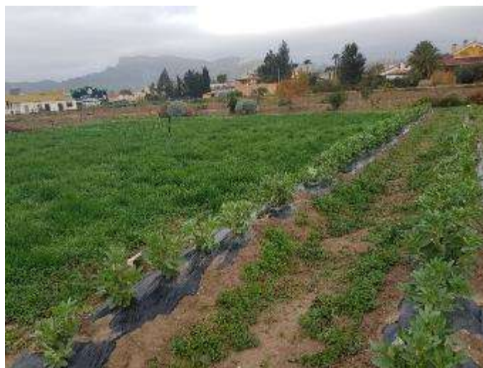
24 de enero (habas en primer plano, a la izquierda veza-avena)