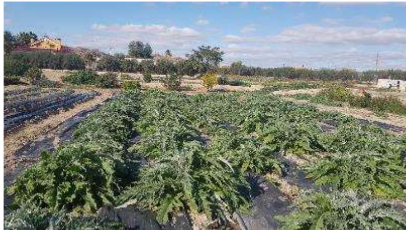
15 de noviembre (desarrollo de la variedad Blanca de Tudela)