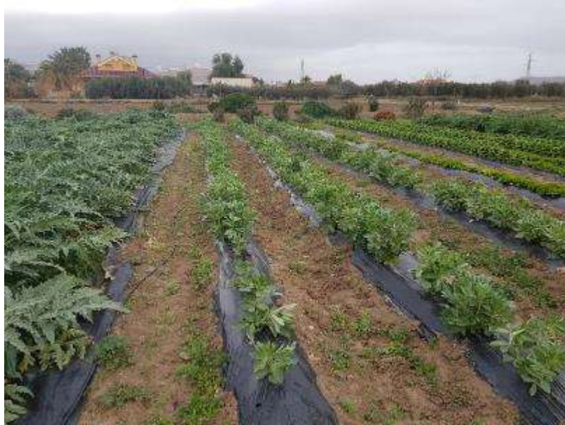
24 de enero -alcachofa híbrida Lorca (a la izquierda), habas (en el centro); lechuga, escarola y alcachofa Blanca de Tudela (a la derecha)-