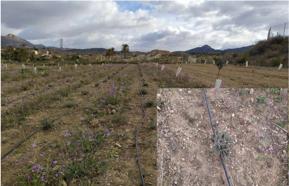
Foto 6. Sector A Helianthemus violaceum a fecha 8 de febrero de 2021