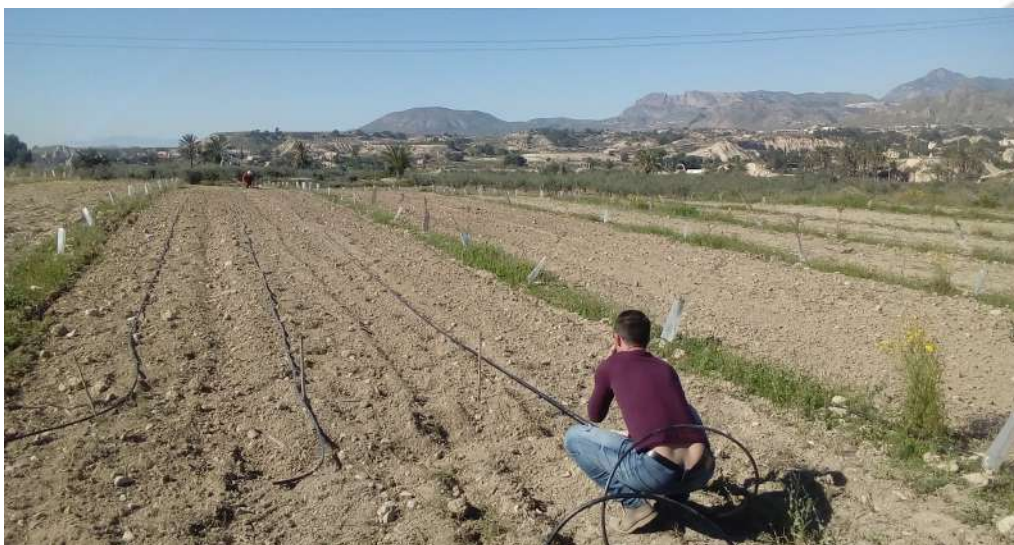
Foto 5 Instalación de riego de la parcela demostrativa (24-02-2020)