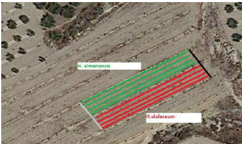
Foto 4. Diseño de plantación y riego.