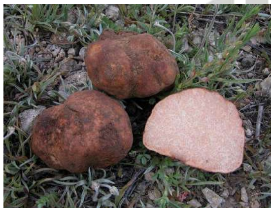
Foto2: Turma del desierto ( Terfezia claveryi )