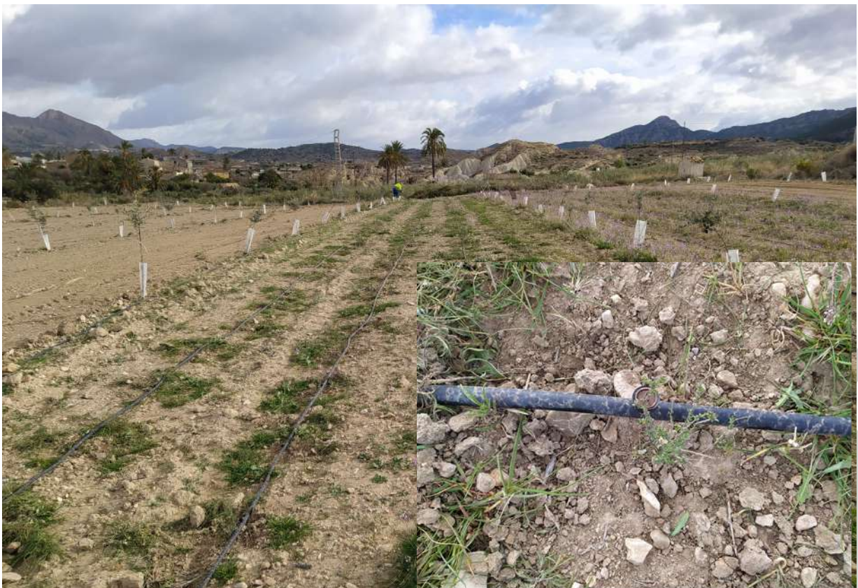
Foto 7. Sector B H. almeriense a fecha 8 de febrero de 2021. Nótase el poco desarrollo de las plantas en la plantación de otoño.