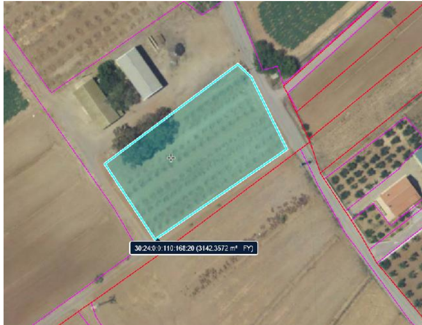
Figura 3. Recinto SIGPAC 20, parcela 168, polígono 110.