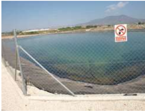
Embalse de riego Las Nogueras.