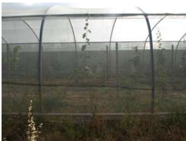
Plantación de Kiwis CDA Las Nogueras.

El Kiwi " Actinidia deliciosa " es un frutal subtropical originario de China y domesticado en Nueva Zelanda, es una planta hermafrodita por sus flores, pero dioica funcionalmente dado que los cultivares que se comportan como femeninos requieren de polinizadores para dar buenas producciones. Es una planta liana, es decir, trepadora o que requiere de estructura de soporte para su desarrollo. Tiene un sistema radicular muy superficial y es sensible al laboreo.