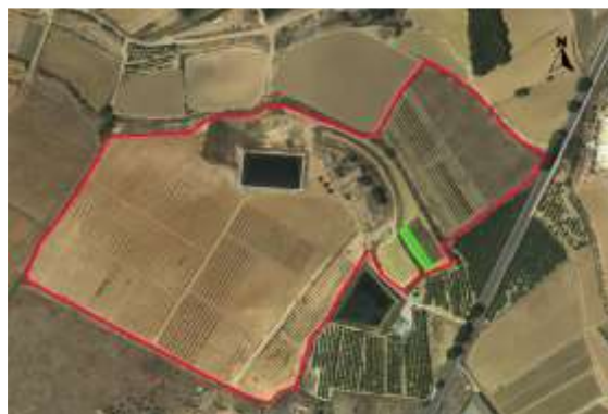
Croquis ubicación del cultivo del kiwi CDA Las Nogueras.

La superficie de la parcela demostrativa dentro del proyecto es de 0,05 ha.