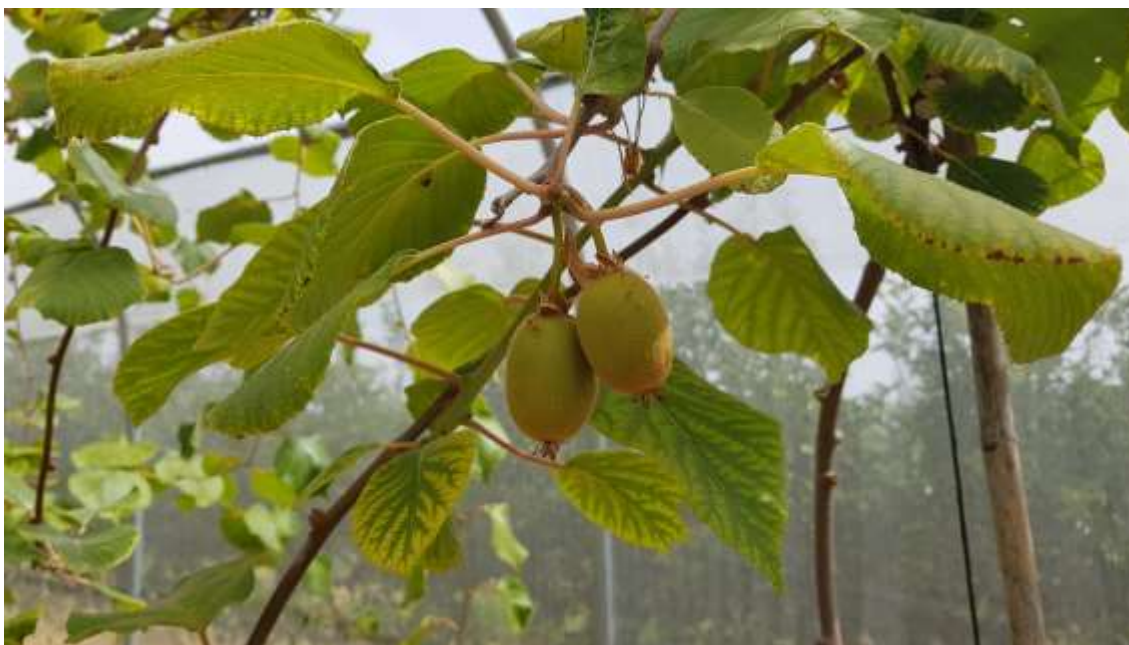
Frutos del kiwi amarillo de la variedad Dori en el CDA Las Nogueras.

En el año 2.016 se realiza la plantación de un proyecto diseñado para ocho años y para el que, previamente, se han realizado varias actuaciones.