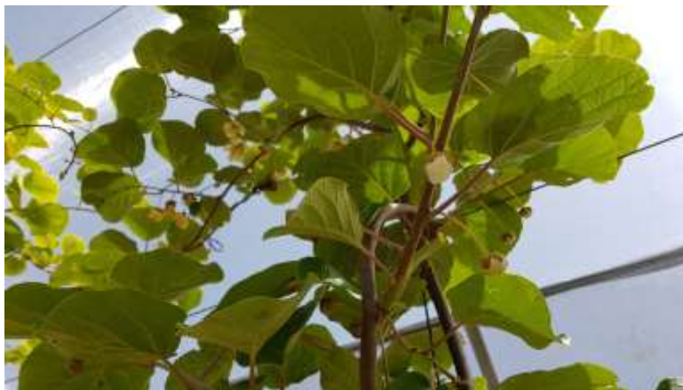
Floración de Kiwis. CDA Las Nogueras.

España tiene un buen consumo per cápita, con 1,6 kg/habitante, similar al de Francia.