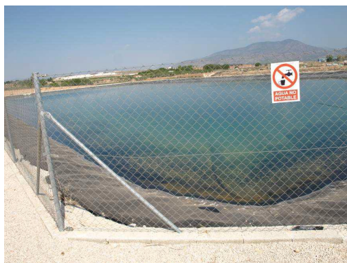
Embalse de riego.