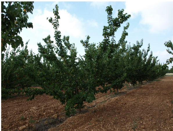
Albaricoqueros tardíos en finca Las Nogueras (2018).

El cultivo del albaricoquero tiene una zona de desarrollo restringida, principalmente por el frío, aunque es capaz de soportar el frío invernal, sus yemas, flores y frutos son sensibles a éste, factor que limita su cultivo en zonas templadas o frías como el noroeste murciano, donde se cultivan variedades de recolección medio-tardías para evitar los daños de heladas y sacar producciones fuera del periodo de comercialización de la mayor parte de la Región.