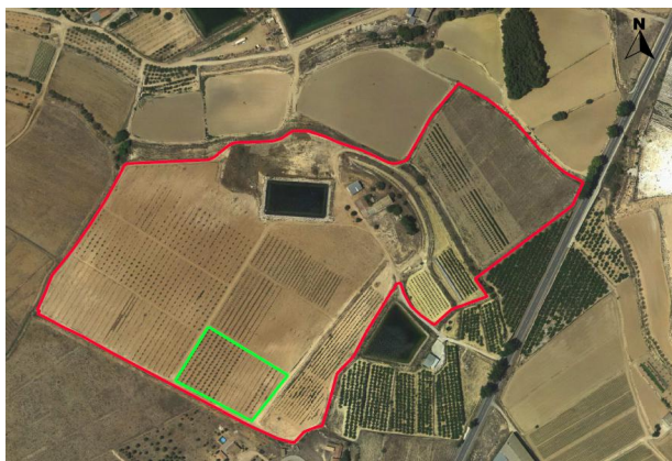
Ubicación de los albaricoqueros.