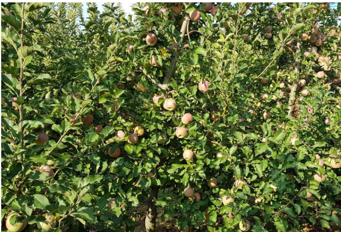
Producción de la variedad Zhen Aztec. 2020