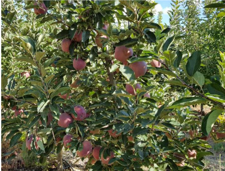
Variedad roja Jeromine.

Se conduce en eje central, con todos los árboles sujetos en un solo alambre a media altura que recorre una estructura de madera.