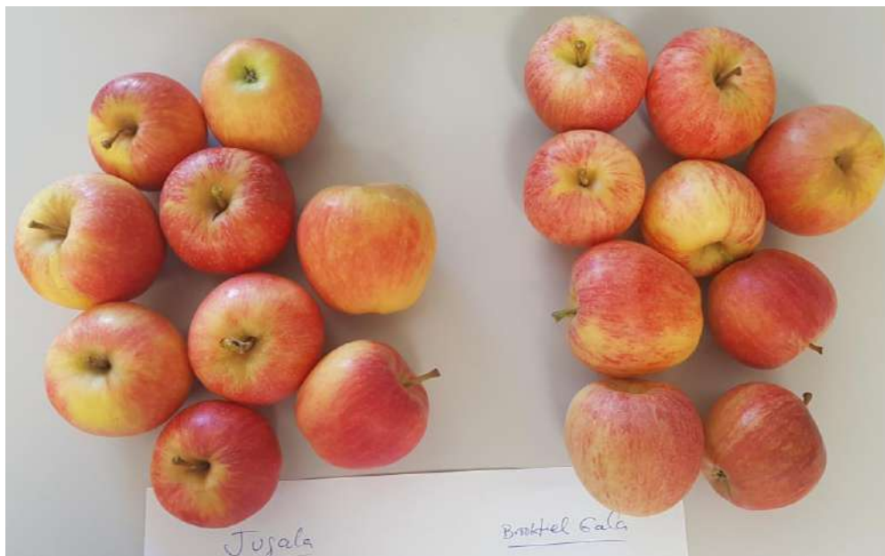
Manzanas del grupo gala en 2020