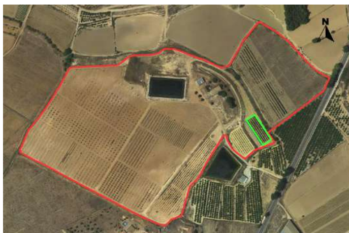
Croquis de ubicación de manzanos CDA Las Nogueras de Arriba.

El proyecto se encuentra situado en una pequeña parcela con coordenadas UTM-Huso 30 (ETRS-89); 596.044/4.210.808 ubicada en el CDA Las Nogueras de Arriba, propiedad de la Comunidad Autónoma de la Región de Murcia, catastralmente en las parcelas 385 del polígono 129 en el paraje Los Prados, T.M de Caravaca de la Cruz.