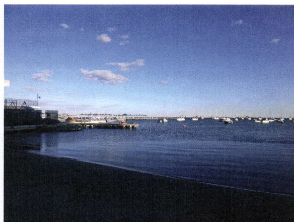
Figura 2. Se observan los pantalanes existentes así como parte de las embarcaciones fondeadas alrededor de la citada instalación náutico-deportiva.