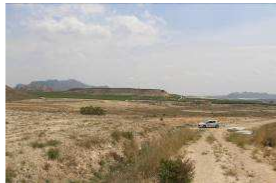
Panorámica de la finca desde la balsa de la Comunidad de