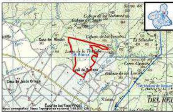
Mapa de localización

El proyecto es colindante en un tramo situado al este de la actuación, con el espacio natural protegido "Parque Regional Sierra de La Pila", con el lugar de interés comunitario (LIC ES6200003) y con la zona de especial protección para las aves (ZEPA ES0000174) "Sierra de La Pila".