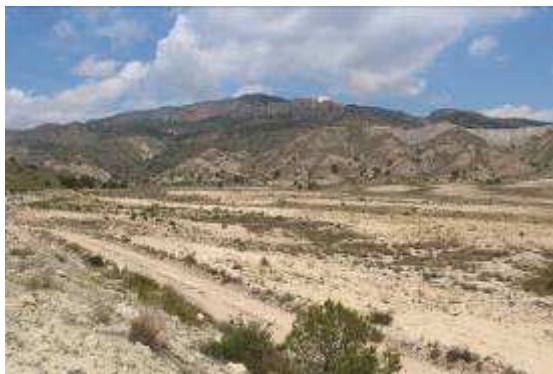
Panorámica de la finca desde la balsa de la Comunidad de

Respecto al resto de la superficie, que según la información que se desprende de las ortofotos disponibles fue roturada entre los años 2007 y 2008 (como se mostrará en las imágenes de los apartados siguientes), se observan ciertos indicios de regeneración de hábitats en una superficie apreciable de la parcela, principalmente alrededor de los surcos de escorrentía en el terreno. También se observaron varios pies de tarajes, estando todas las especies del género Tamarix dentro de la categoría “de interés especial” en el anteriormente citado Catálogo Regional.