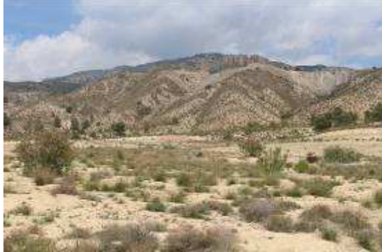
Varios ejemplares de tarajés dispersos por la finca