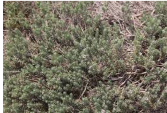
Ejemplar de Teucrium libanitis

El promotor indica que en la zona sur (parcela 396), no ha podido encontrarse vegetación ni especies de flora de interés, salvo algunos olivos de gran porte, lo que también fue observado por los técnicos de este Servicio. En esta zona se contempla un proyecto de restauración vegetal, cerca de la balsa grande.