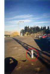
Fig 6.- Zona exterior