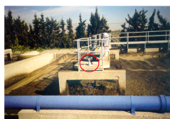
Fig 4.- Zona de estabilización biológica