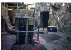
Fig 3.- Zona de entrada del agua a la planta