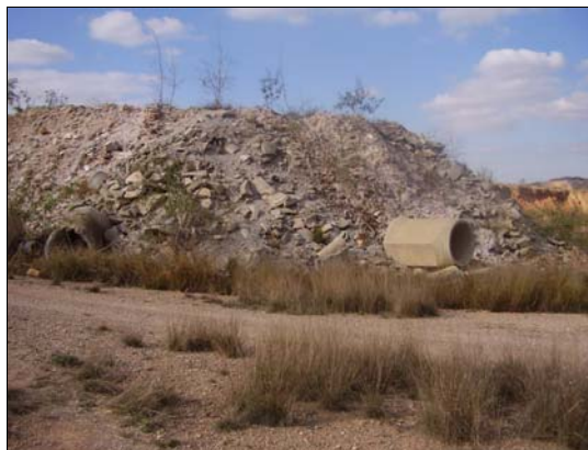
FOTO 5 Detalle de la escombrera nº 4.