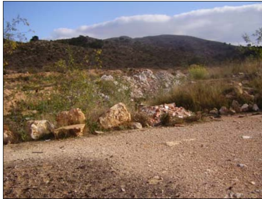
FOTO 7 En el centro de la fotografía se aprecia la escombrera nº 6.