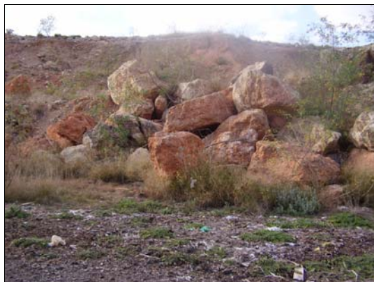
FOTO 9 Detalle de tipo de vertido en la zona nº 6.