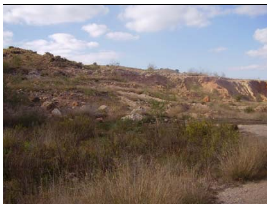
FOTO 6 Vertidos en la zona nº 5.