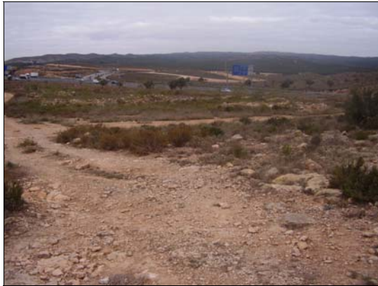
FOTO 1 Panorámica de la zona del vertido nº 1 y nº 2, próximos a la autovía A-7 .