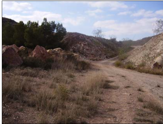
FOTO 4 Vista general de los taludes del ver tadero nº 4.