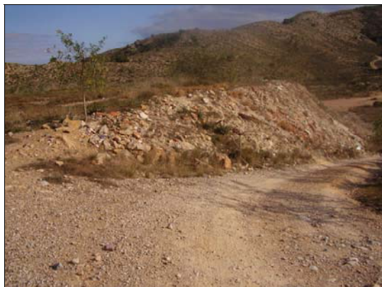
FOTO 3 Terraplén de escombros nº 4.