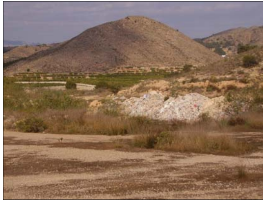
FOTO 8 Panorámica de la zona de vertido nº 6.