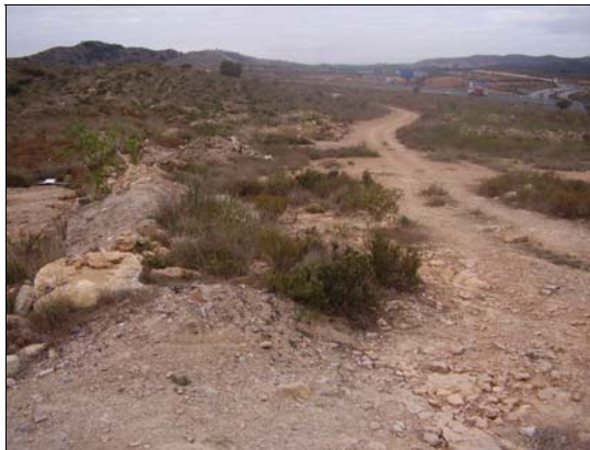
FOTO 2 A la izquierda aparece el vertido correspondiente a la zona nº 3.