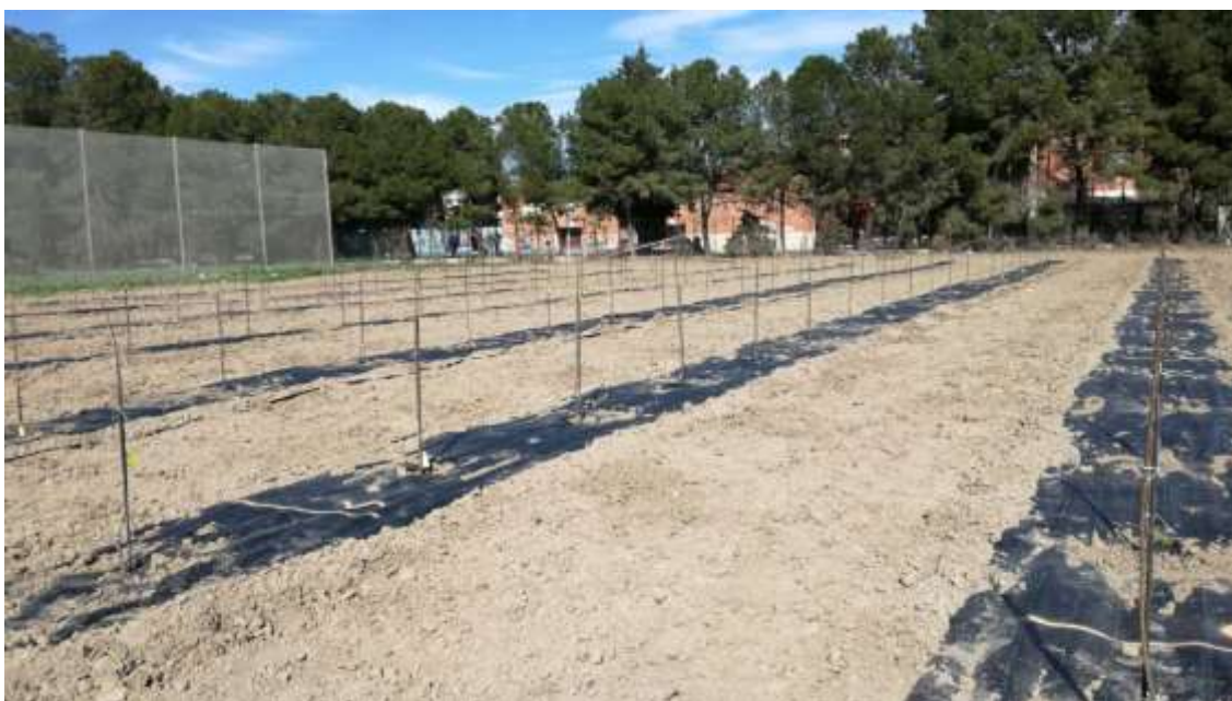
Foto nº 1. Parcela plantada febrero 2017

Se realizó el arranque a raíz desnuda, se seleccionan los mejores 12 árboles de cada semilla, dejando el resto para la fila borde.