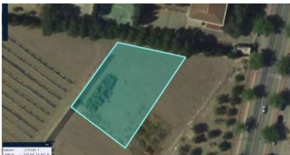
Figura nº 1. Ubicación de la parcela objeto del ensayo de patrones

Se trata de una parcela con una superficie total de 1700 m 2 , en la que se disponen 8 filas de árboles separadas 4 metros. Las filas se orientan norte sur (noreste suroeste) y su longitud va creciendo desde el borde oeste que linda con el cortavientos de la parcela de cítricos hasta el del este que limita con la parcela ensayo de patrones de almendro en siembra directa.