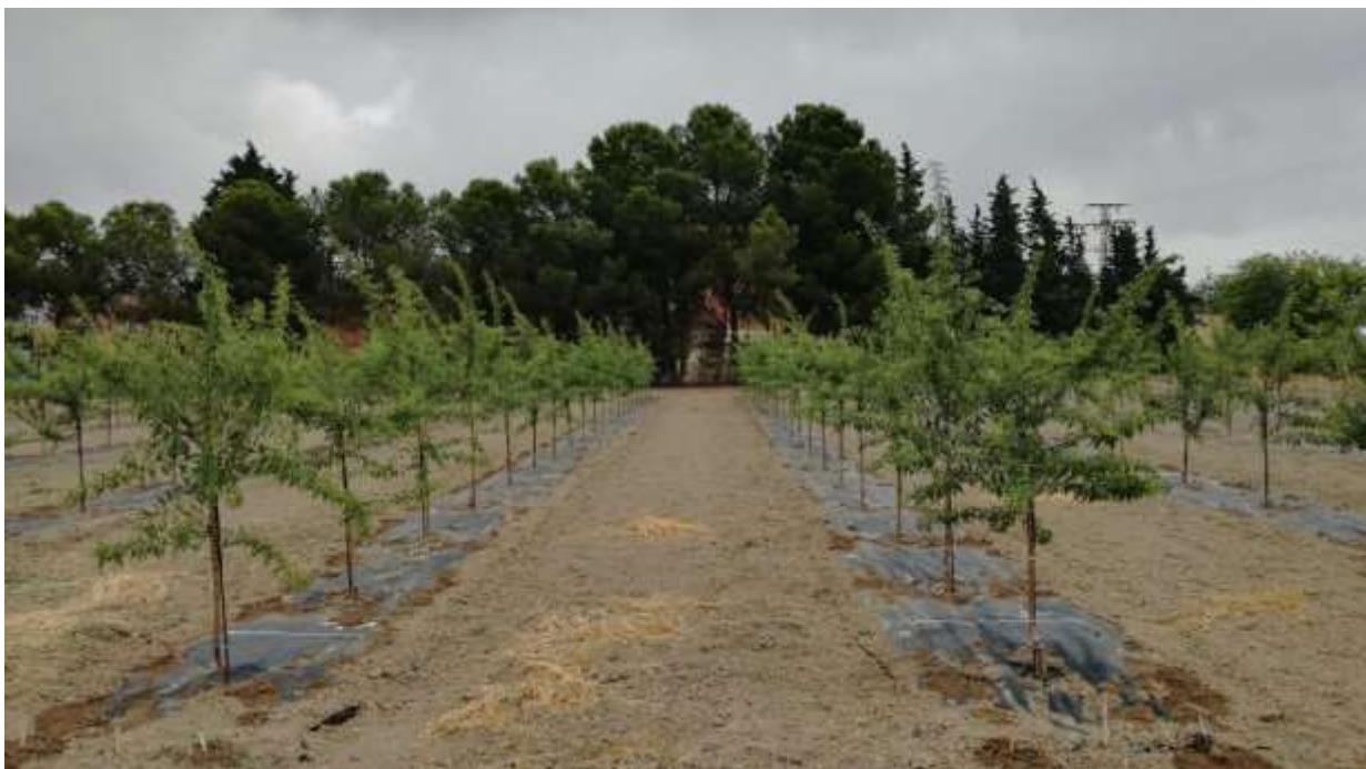
Foto nº 2. Parcela en julio 2017

Se produjeron 7 marras en la plantación, pero en las filas borde, donde se colocó la planta de peor calidad, que se replantaron en enero de 2018, con restos de planta que se dejó en el vivero.