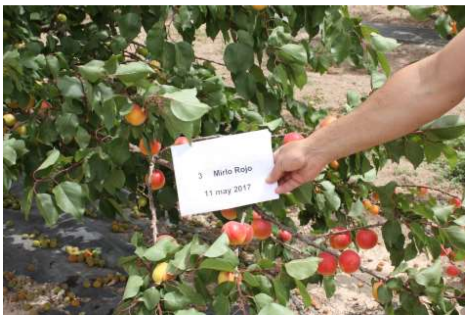
Foto nº 2. Árbol de la variedad Mirlo Rojo antes de su recolección, 11 de mayo de 2017.

Los valores de producción sólo podrán ser tomados como orientativos dado el poco número de árboles del ensayo, y no tener repeticiones.