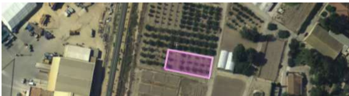
Figura nº1. Ubicación del ensayo de albaricoqueros en el CIFEA de Torre Pacheco