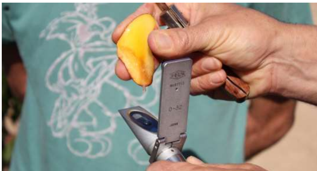
Foto nº1. Medida de los grados Brix en frutos con el refractómetro.

Las labores culturales a realizar son: poda, labor de cultivador y/o fresadora en el centro de las calles, desbrozado en el borde entre la zona de laboreo y la tela cubre suelos, fertirrigación, tratamientos fitosanitarios, recolección y análisis de los datos.