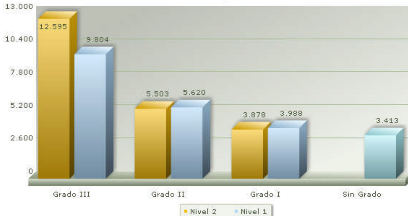
Grados y Niveles