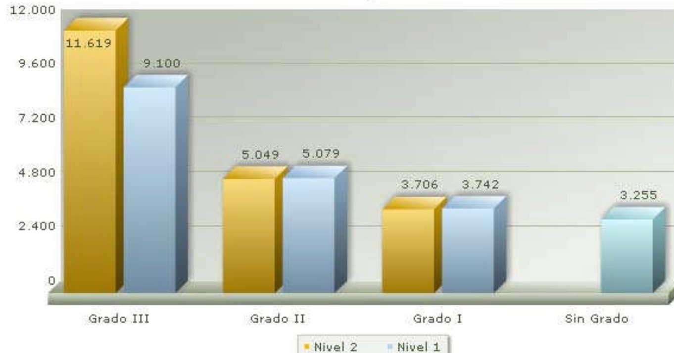
Grados y Niveles