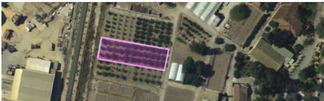
Figura nº 1. Ubicación del ensayo de variedades de almendro.

La referencia del SIGPAC del CIFEA, es Polígono 19 parcela 9000, en la que engloba una gran cantidad de terreno, en la que está el CIFEA.