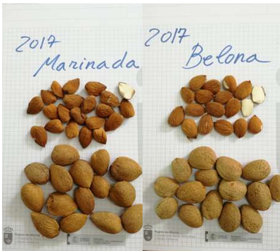
Fotos nº 2 y 3. Almendras de las variedades 'Marinada' y 'Belona' tras su recolección y seca.

Se realizará un escandallo para ver la calidad de los frutos; presencia de dobles, almendras enfermas o defectuosas, etc.