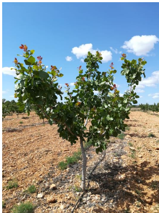
Parcela demostrativa de variedades y patrones de pistacho en CDA "Las Nogueras" (2018).

Trabajadores y personas relacionadas con el sector agrario tales como agricultores, técnicos y estudiantes.