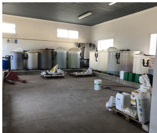
Cabezal de riego

Se abonará teniendo en cuenta las características del cultivo y los análisis del agua y suelo, reduciendo progresivamente la aplicación de abonado nitrogenado de síntesis química para aproximarnos a una fertilización ecológica..