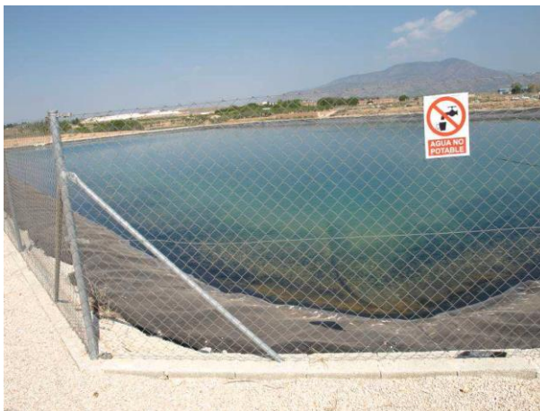
Embalse de riego CDA Las Nogueras.