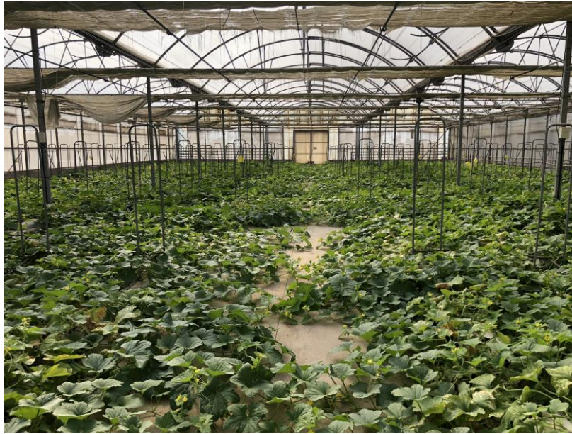
Vista general del invernadero

El cultivo se encuentra en el día 43 del ciclo de cultivo, fue trasplantado el 11 de septiembre.