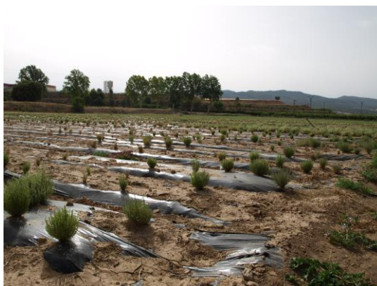
Cultivo de tomillo y mejorana julio 2018

En el proyecto de cultivo de variedades de tomillos y mejorana en el CDA Las Nogueras se quiere comprobar si estas plantaciones pueden ser una alternativa rentable para la diversificación de cultivos en esa zona, además de conocer el manejo de este cultivo y la forma de obtención de aceite esencial con datos productivos.