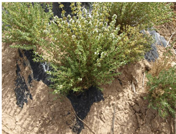
Detalle de tomillo con abejas polinizadoras (20/07/2018).

Actualmente, existe una enorme preocupación por el uso de fitosanitarios en la Agricultura y la supervivencia de estos insectos tan beneficiosos. Existen alternativas o formas de actuar que nos ayudan hoy día a producir una repercusión mínima sobre estos insectos tan beneficiosos y a la larga también sobre el equilibrio biológico en las plantaciones.