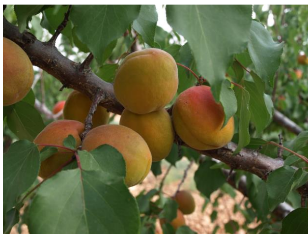
Detalle de frutos de albaricoque.

La recolección se comenzó el 20 de junio con la variedad 9-88 con una pequeña cantidad recolectada, ya que está en su segundo año en verde y no ha arrancado la plena producción. Se estima finales de julio como la finalización de la recolección de la totalidad de variedades.