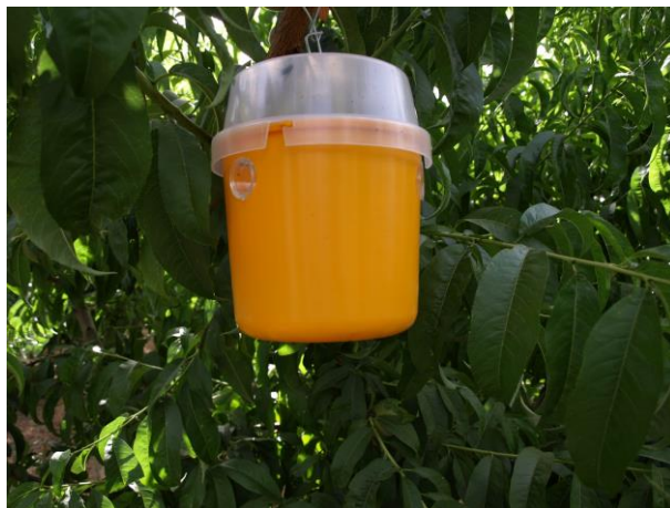
Trampa de atrayente y retención mosca de la fruta.

Existe al igual que en melocotonero 2 trampas de monitoreo para la plaga de mosca de la fruta ( Ceratitis capitata ).