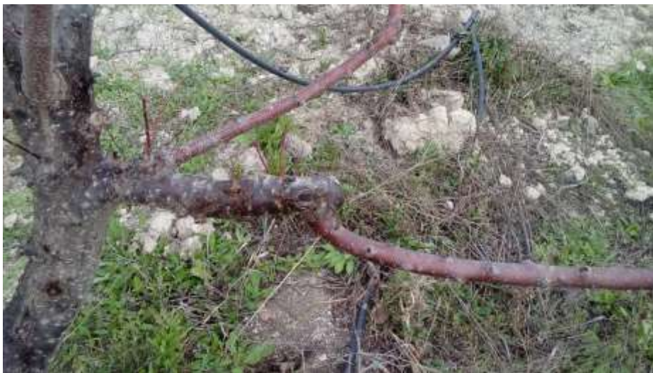
Detalle del crecimiento de los injertos de la nueva variedad en febrero de 2020

A lo largo de todo el ciclo vegetativo se cuidan los injertos y se despolliza las ramas procedentes de la variedad anterior.