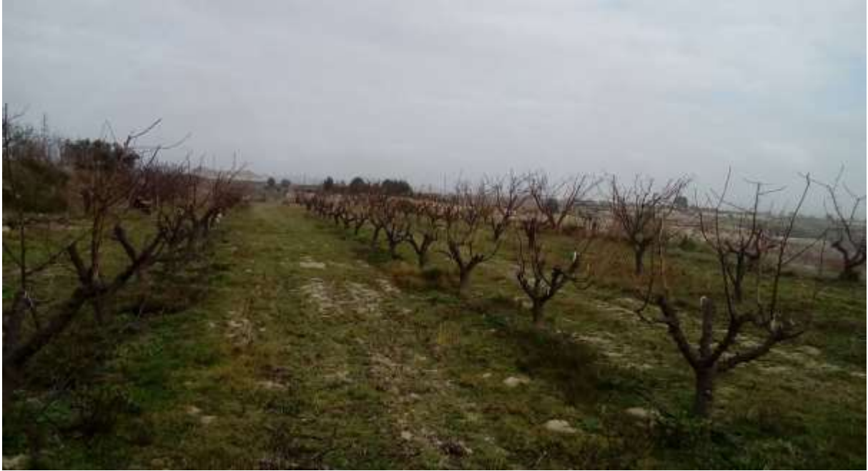
Aspecto de la plantación en febrero de 2020

En enero se siguen rebajando el material vegetal de los árboles de las anteriores variedades para favorecer el crecimiento de los nuevos injertos y se podan los arboles de las variedades que se siguen conservando (Murciana y Valorange). Los restos de poda se pican y se incorporan a l suelo.