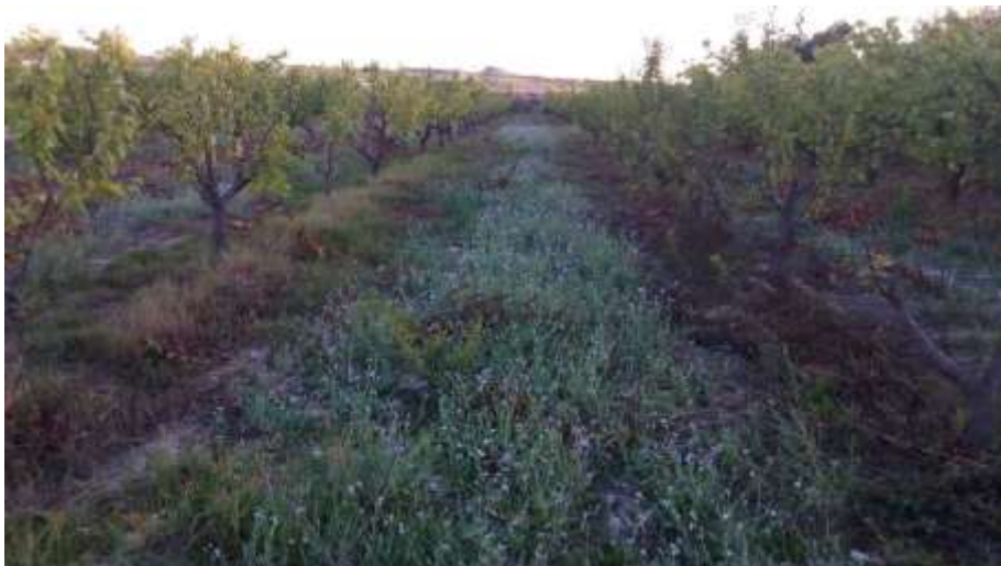
Aspecto de la reinjerta de la parcela demostrativa. Octubre 2019

En el año 2018, tal como se describió en la correspondiente memoria, se reinjertaron las variedades anteriores por las últimas selecciones Cebas: Cebas Red, Primor, Cebas 57, con menores exigencias de frío invernal. La procedencia del material vegetal ha sido suministrado gratuitamente por CEBAS frutis®