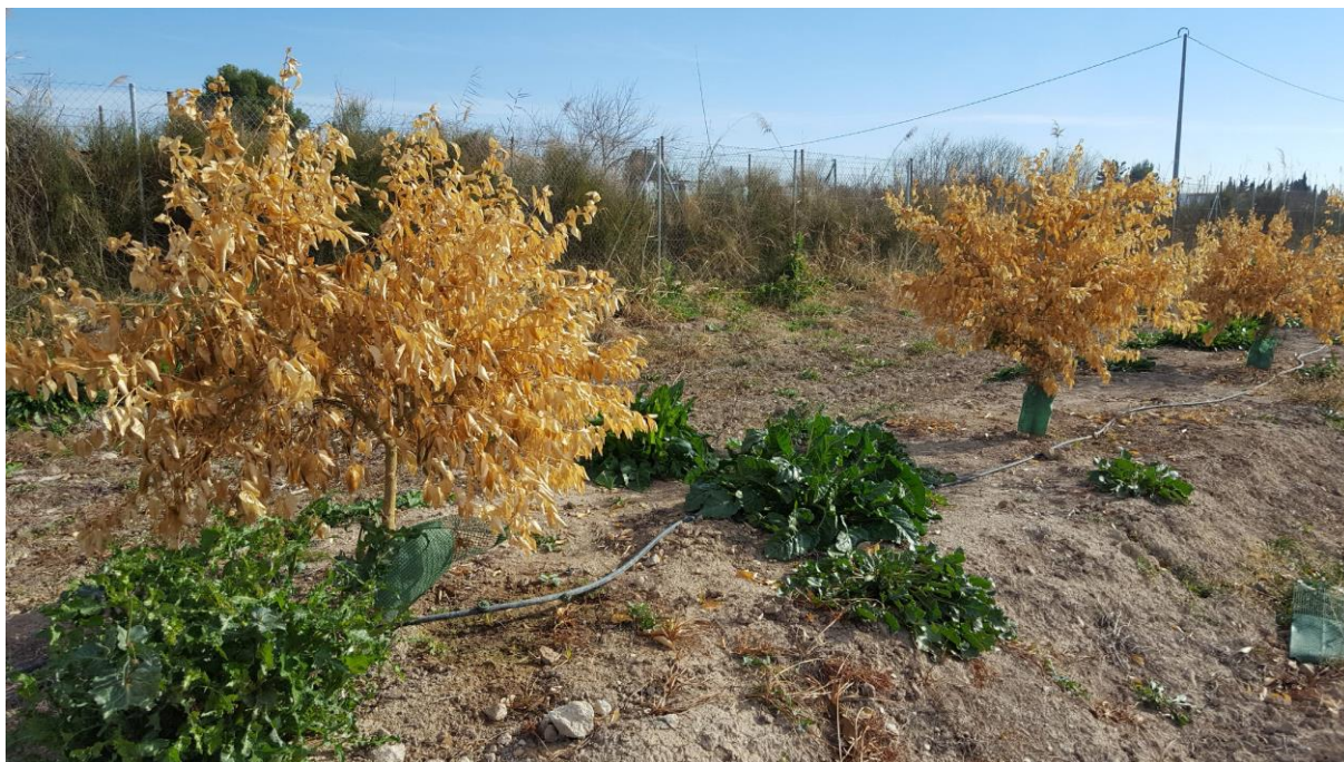
Lima mejicana tras heladas diciembre 2017.