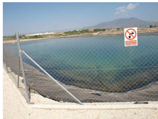
Embalse de riego Las Nogueras.