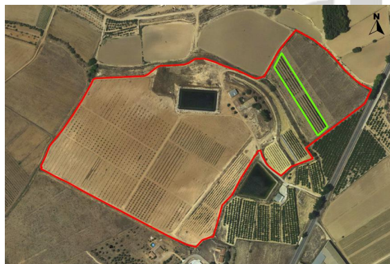
Croquis ubicación de melocotoneros CDA Las Nogueras.

El proyecto se desarrolla en la Finca Experimental de “las Nogueras”, en el término municipal de Caravaca de la Cruz, catastralmente en parte de la parcela 385 del polígono 129, ubicado entre las parcelas de demostración de nogal, al noreste y las de pistacho y trufa negra al suroeste, según el croquis de ortofoto: