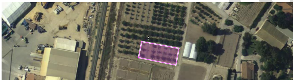
Figura nº1. Ubicación del ensayo de albaricoqueros en el CIFEA de Torre Pacheco