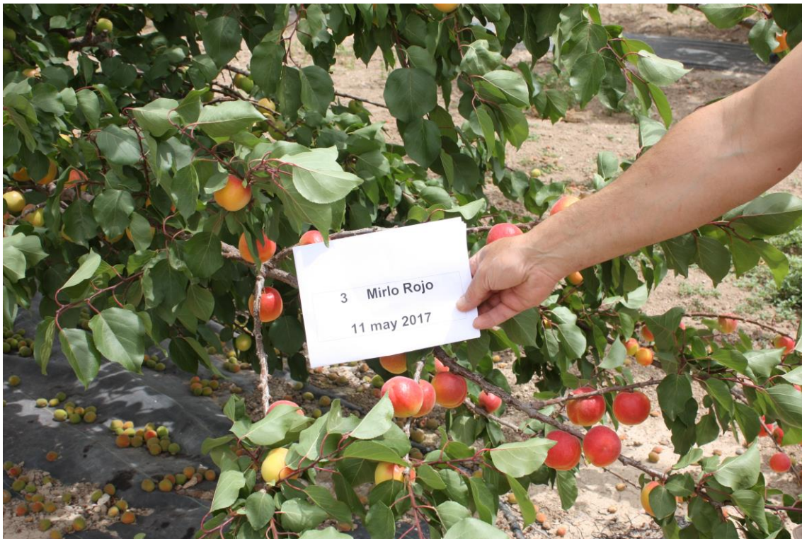
Foto nº 2. Árbol de la variedad Mirlo Rojo antes de su recolección, 11 de mayo de 2017.

Los valores de producción sólo podrán ser tomados como orientativos dado el poco número de árboles del ensayo, y no tener repeticiones.