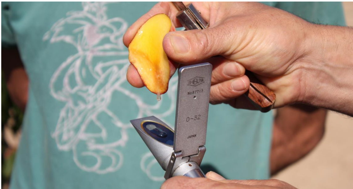
Foto nº1. Medida de los grados Brix en frutos con el refractómetro.