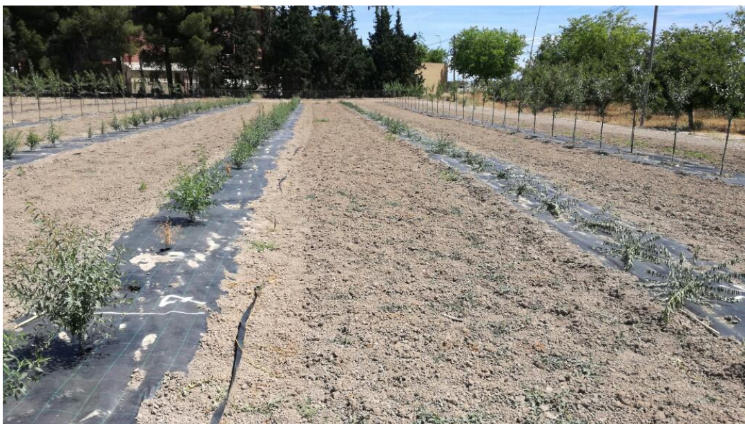
Foto nº 1. Fila de la derecha decapitada una semana después del injerto, 15 de mayo de 2017.

Una semana después de realizado el injerto se procede a decapitar el patrón para forzar la brotación del injerto. Esta operación es la más delicada porque hay que tener un alto porcentaje de prendimiento para que sea viable.