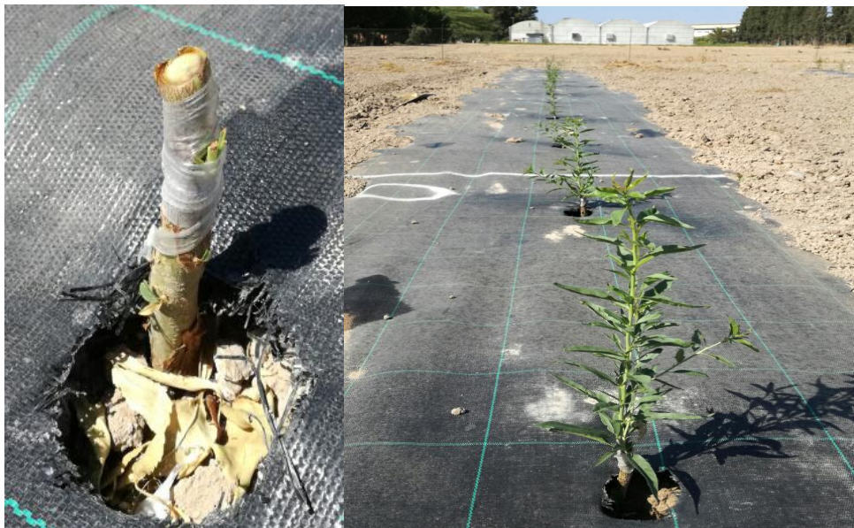
Fotos nº 2 y 3. Detalle de árbol injertado, 15 de mayo de 2017. Desarrollo de los injertos 21 de junio 2017.

A continuación, se realizaron los trabajos culturales de limpieza de los injertos para obtener una planta con el tronco de unos 60 cm, a partir de ahí se deja la formación libre con eje central para formar un seto o muro frutal.