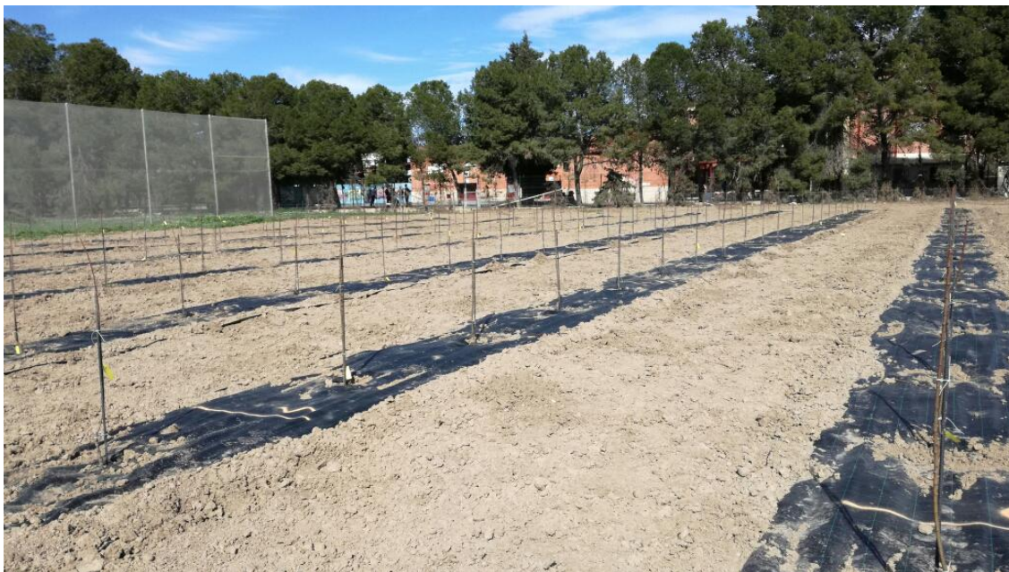
Foto nº 1. Parcela plantada febrero 2017

Se realizó el arranque a raíz desnuda, se seleccionan los mejores 12 árboles de cada semilla, dejando el resto para la fila borde.