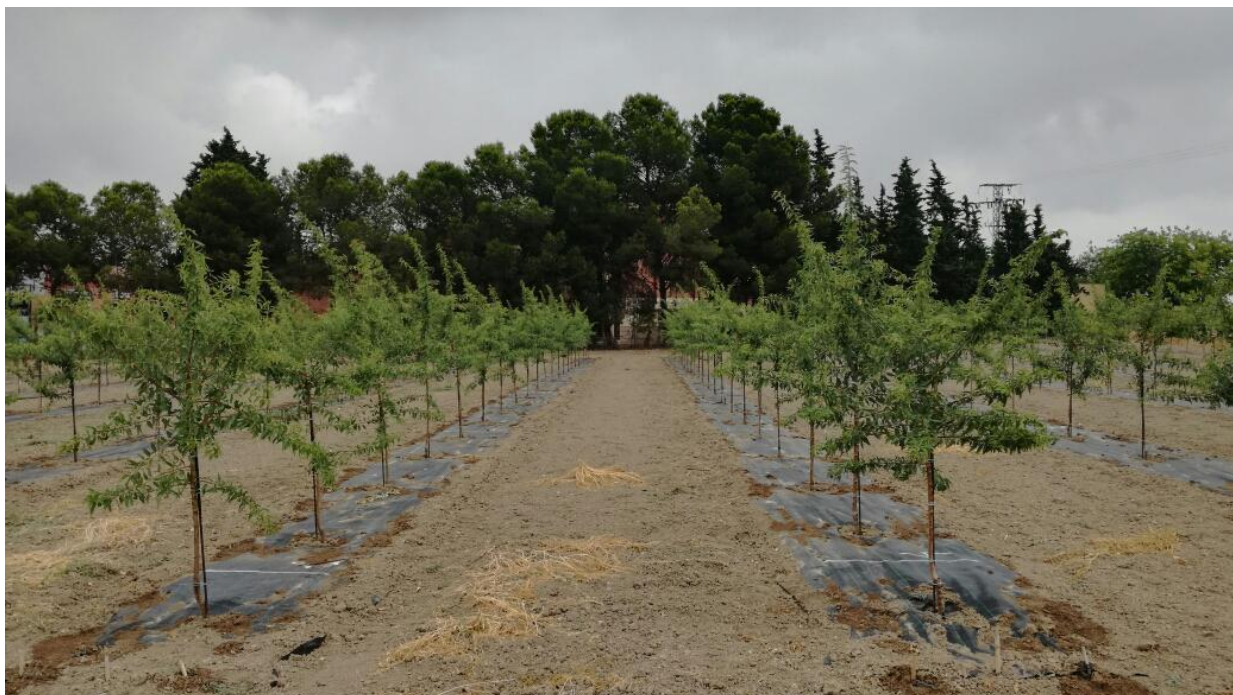
Foto nº 2. Parcela en julio 2017

Se produjeron 7 marras en la plantación, pero en las filas borde, donde se colocó la planta de peor calidad, que se replantaron en enero de 2018, con restos de planta que se dejó en el vivero.