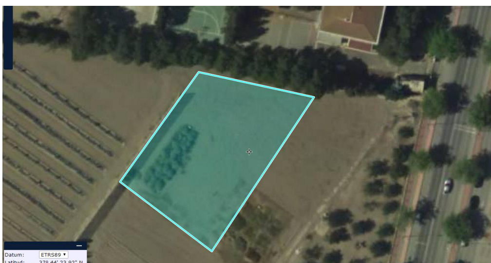
Figura nº 1. Ubicación de la parcela objeto del ensayo de patrones

Se trata de una parcela con una superficie total de 1700 m 2 , en la que se disponen 8 filas de árboles separadas 4 metros. Las filas se orientan norte sur (noreste suroeste) y su longitud va creciendo desde el borde oeste que linda con el cortavientos de la parcela de cítricos hasta el del este que limita con la parcela ensayo de patrones de almendro en siembra directa.