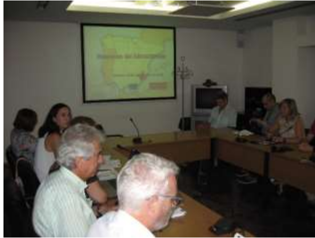
Reunión de GRADIMUR ( septiembre 2018)

En lo que respecta a la obligación de que el estado miembro disponga de un portal web único desde el que se acceda a toda la información referida al FEDER en España, con la finalidad de garantizar transparencia en la utilización del FEDER y habilitar un canal de comunicación de fácil acceso, en el caso de la Comunidad Autónoma de Murcia su información ya está disponible mayoritariamente en dicho portal, si bien en el momento actual se está poniendo en marcha la estructura común de todos los apartados de todos los organismos de todos y cada uno de los programas Operativos y se está dotando de contenidos a todos ellos. Se espera que a lo largo del año se vaya avanzando para que todos cuenten ya con información actualizada en los ámbitos de la programación, la gestión, la evaluación y la comunicación de los fondos FEDER y FSE recibidos por cada Organismo