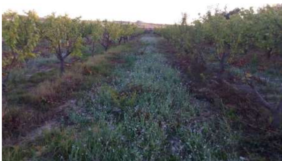
Aspecto de la reinjerta de la parcela demostrativa. Octubre 2019

En el año 2018, tal como se describió en la correspondiente memoria, se reinjertaron las variedades anteriores por las últimas selecciones Cebas: Cebas Red, Primor, Cebas 57, con menores exigencias de frío invernal. La procedencia del material vegetal ha sido suministrado gratuitamente por CEBAS frutis®