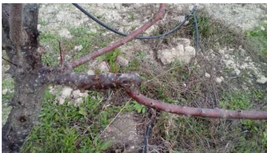
Detalle del crecimiento de los injertos de la nueva variedad en febrero de 2020

A lo largo de todo el ciclo vegetativo se cuidan los injertos y se despolliza las ramas procedentes de la variedad anterior.