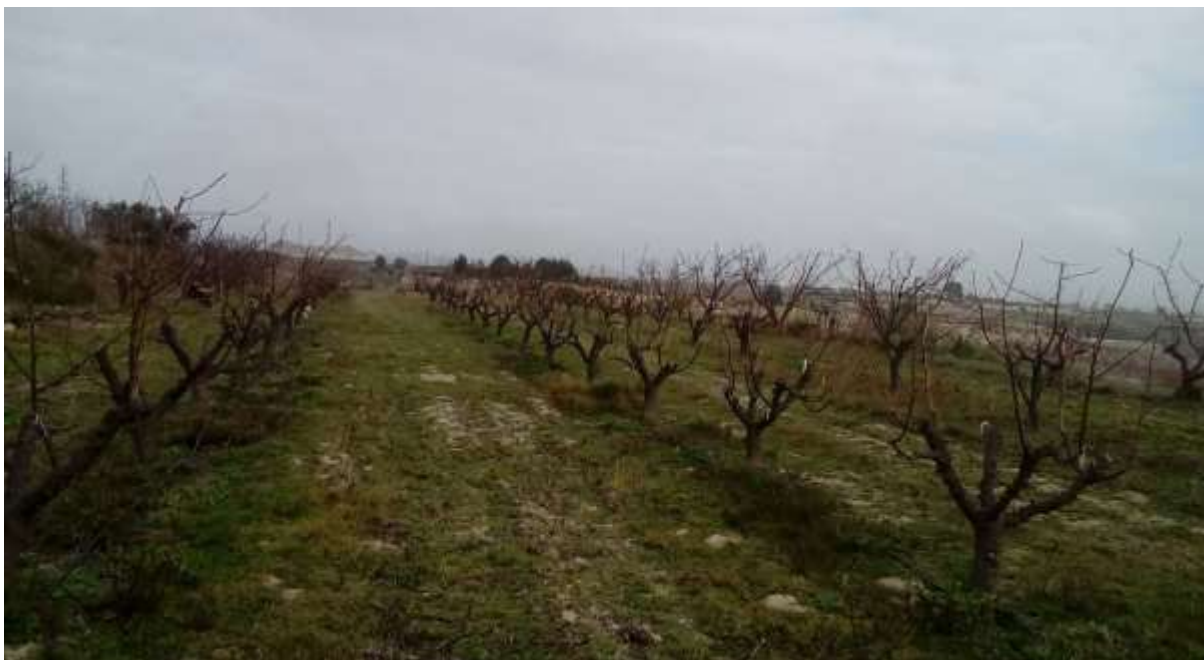
Aspecto de la plantación en febrero de 2020

En enero se siguen rebajando el material vegetal de los árboles de las anteriores variedades para favorecer el crecimiento de los nuevos injertos y se podan los arboles de las variedades que se siguen conservando (Murciana y Valorange). Los restos de poda se pican y se incorporan a l suelo.