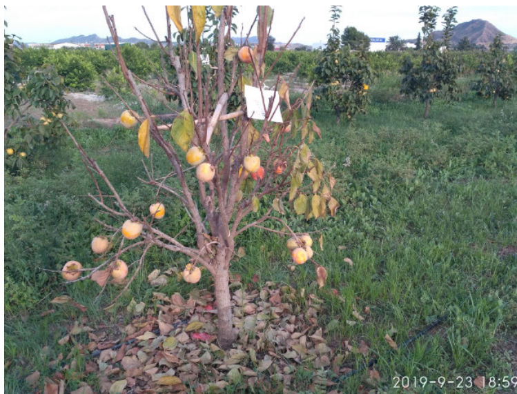
Árbol totalmente defoliado como consecuencia de los encharcamientos y asfixia producidos por la DANA de septiembre

A raíz de las lluvias acaecidas en el mes de septiembre (DANA) bastantes de los árboles sobre D. lotus ya endurecidos como hemos dicho mostraron un decaimiento acentuado y la cosecha de estos árboles se perdió.