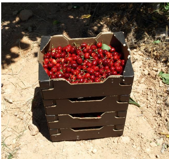
Cajas de recolección variedad Brooks (15/06/2018).