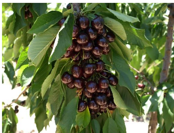
Frutos de cerezo variedad Santina (21/06/2018).

El objetivo de la jornada fue la transferencia de los resultados de la investigación y las parcelas demostrativas de cerezo en la Región de Murcia y, en concreto, las características vegetativas y productivas de 34 variedades de cerezo, en riego localizado de la Comarca del Noroeste: sus fechas de floración, recolección, precocidad, producción, calibre y calidad de cosecha, así como sus técnicas de cultivo y la influencia en la producción de los patrones más representativos.