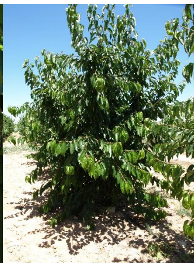
Árbol New Star recolectado (21/06/2018).