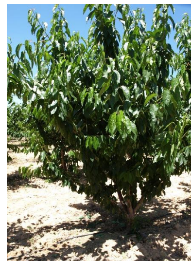
Árbol de Brooks recolectado (21/06/2018).

El proyecto plurianual del cerezo en el CDA de Las Nogueras, pertenece a las acciones financiadas dentro de la Medida 1 “Transferencia de conocimientos y actividades de información”, del Programa de Desarrollo Rural 2014-2020 de la Región de Murcia, cofinanciado por el Fondo Europeo Agrícola de Desarrollo Rural (FEADER), el Ministerio de Agricultura, Pesca y Alimentación y la Comunidad