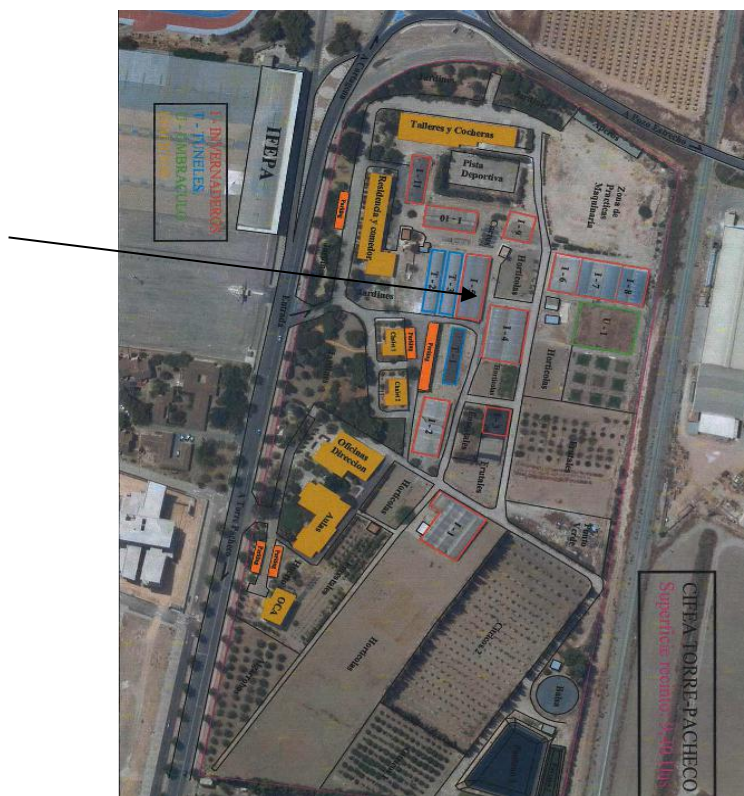
Figura 1. Plano del CIFEA de Torre-Pacheco y ubicación del ensayo en esta anualidad 2019-2020.

El proyecto estará ubicado en el CIFEA de Torre-Pacheco.