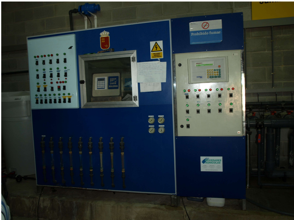
Programador de riego