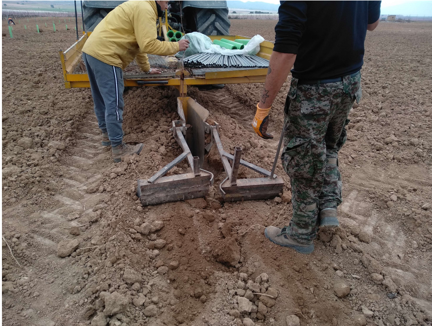
Demostración del comportamiento de diferentes variedades de pistacho en la Comarca del Altiplano