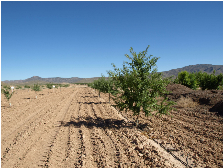
Evaluación y demostración del comportamiento de variedades almendro de floración tardía en la comarca del Altiplano