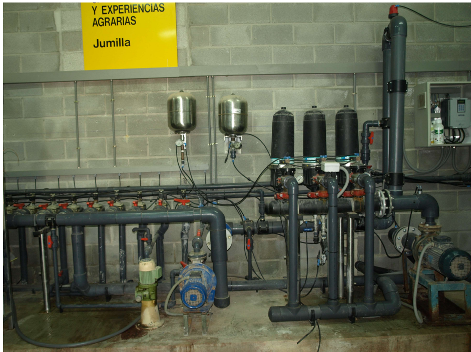
Filtros y tanques de la instalación de riego