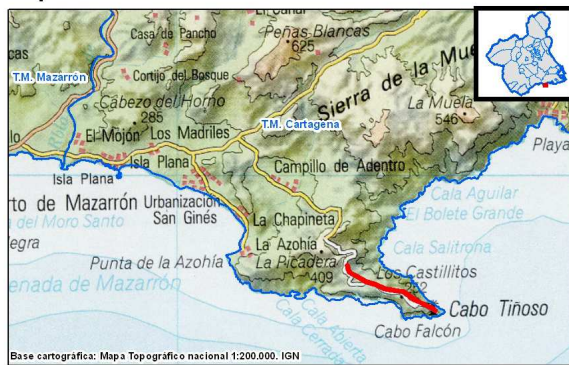
Mapa de localización

El proyecto se localiza concretamente en el paraje “Coto del Cabo” en “Cabo Tiñoso”, dentro del Espacio Natural (EN0000012) “Sierra de la Muela, Cabo tiñoso y Roldán”, LIC (ES6200015) “La Muela y Cabo Tiñoso”, Monte Público (M0504) “Cabo Tiñoso y Algameca” y ZEPA (ES0000264) “La Muela-Cabo Tiñoso”.