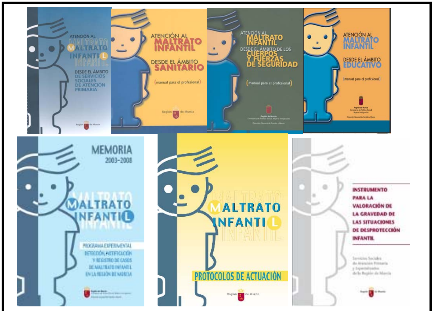
Figura 2: Publicaciones realizadas en el desarrollo del Programa.

Con objeto de favorecer un conocimiento amplio sobre el maltrato infantil, sus indicios, características y protocolos de actuación, se han elaborado manuales dirigidos a los distintos profesionales cuyo ámbito de trabajo implica la atención a la infancia. También se ha publicado el “Instrumento para la valoración de la gravedad de las situaciones de desprotección infantil”, que permite hacer una valoración de la gravedad de las situaciones de desprotección infantil, con criterios consensuados entre los distintos colectivos de profesionales de atención a la infancia y familia, con el asesoramiento técnico de especialistas en el tema.