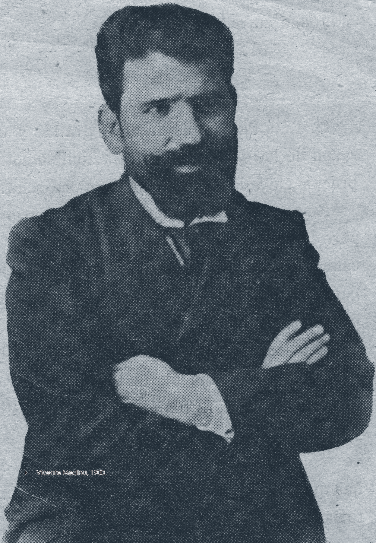
▷ Vicente Medina, 1900.