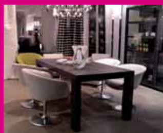
tema recomendado ¿Cómo debemos asegurar nuestro hogar?