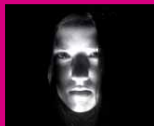
te interesa El trastorno límite de la personalidad