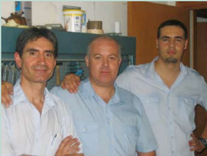
el C.A.M.P. de Churra de Oficial de Servicios Técnicos.