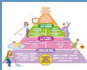
tema recomendado Cómo tratar a la persona mayor en casa