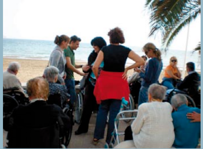
Paseo del puerto de Mazarrón donde los trabajadores organizaron bailes y juegos de pelota con los residentes

Se vuelven a realizar dos excursiones a la playa, a las que se suman un total de 60 residentes. El objetivo de estas, es disfrutar de un día de convivencia con los mayores, de manera que salgan de la rutina y disfruten de un día diferente en compañía de los trabajadores del Centro.