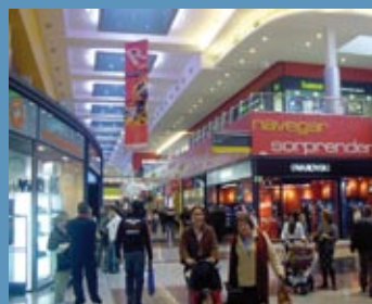
te interesa Estatuto del Consumidor