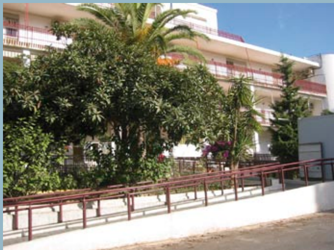
Antiguo Centro de Canteras

H ace más de 30 años se inauguró el antiguo Centro de Canteras como respuesta a la petición de unos padres que pedían atención para sus hijos. Estos chicos tenían unas necesidades muy especiales y su perfil no encajaba en ningún recurso existente.