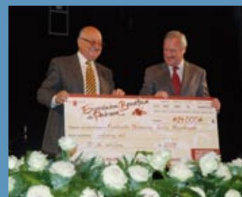
cosas que hacemos