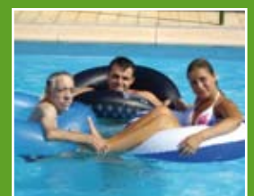
cosas que hacemos