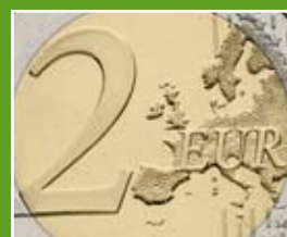
te interesa Créditos rápidos