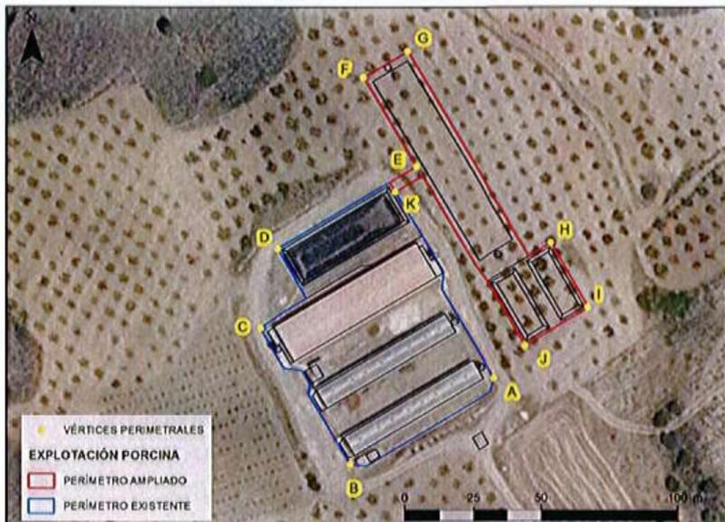
EXLOTACIÓN ACTUAL Y AMPLIACIÓN