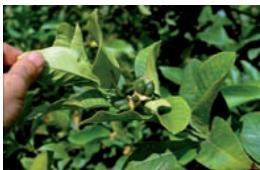
Una adecuada fertirrigación garantiza el cuaje de los frutos y el crecimiento de los mismos.

Estas cantidades son orientativas y deben adaptarse a cada situación. Por ejemplo, los años que por circunstancias comerciales del mercado convenga adelantar el tamaño de los limones, deberán intensificarse los riegos y la fertilización, concentrándolos más en la fase inmediatamente posterior al cuajado del fruto y hasta la parada de verano, período durante el cual el fruto sufre un crecimiento más rápido de forma natural. Se deberá seguir concentrando el riego y el abonado en una segunda fase después de esta parada veraniega y hasta mediados de octubre. Por el contrario, cuando se quiera retrasar el tamaño del limón deberá actuarse en las mismas fases anteriores, pero en este caso restringiendo el uso del agua y los fertilizantes. Conviene saber que, en general, los limoneros que se recolectan muy tarde son los que más disminución de cosecha sufren al año siguiente.