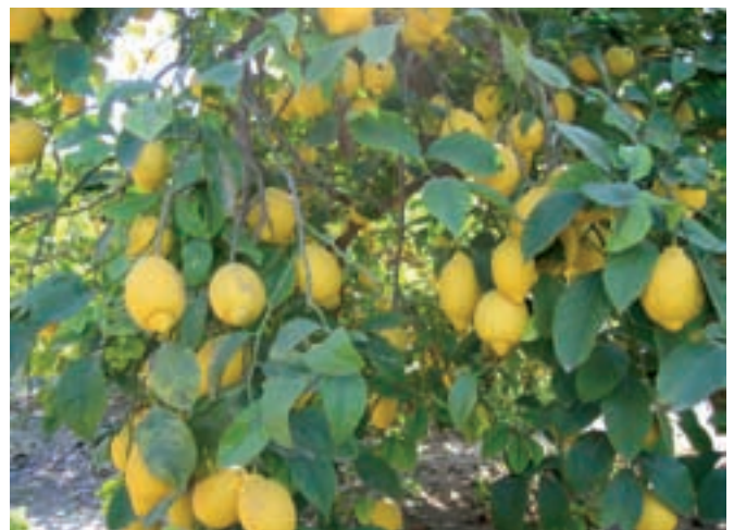
La fertirrigación mediante riego por goteo en el limonero, garantiza producciones altas y constantes.

También conviene indicar en el caso de los fertilizantes dos cuestiones: