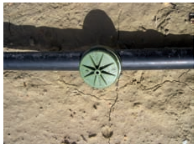
La limpieza periódica de la instalación debe garantizar el buen funcionamiento de la misma y los caudales de los goteros.