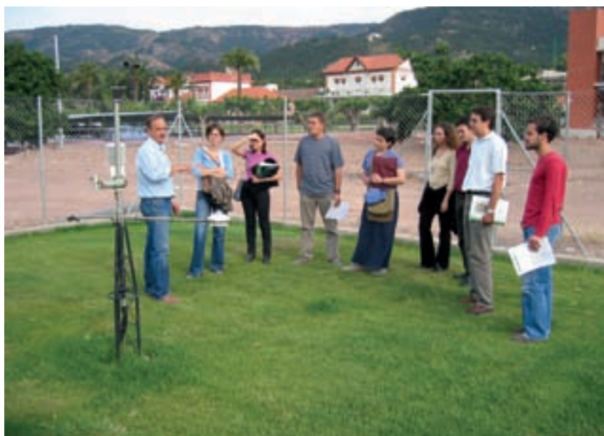
Detalle de una estación agrometeorológica. Los datos obtenidos de la misma sirven para calcular las necesidades de agua de los cultivos.

Para el cálculo de las necesidades de agua del limonero se utilizan métodos empíricos, basados en los datos recogidos a lo largo de varios años, en las distintas estaciones agrometeorológicas que la Consejería de Agricultura y Agua tiene ubicadas estratégicamente por toda la región, y que gestiona el IMIDA (Instituto Murciano de Investigación y Desarrollo Agrario y Alimentario) a través del SIAM (Sistema de Información Agraria de Murcia).