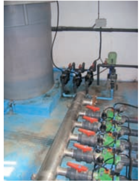
El mantenimiento del cabezal pasa, entre otras cosas, por controlar las presiones y vigilar los tanques fertilizantes y la bomba de inyección.