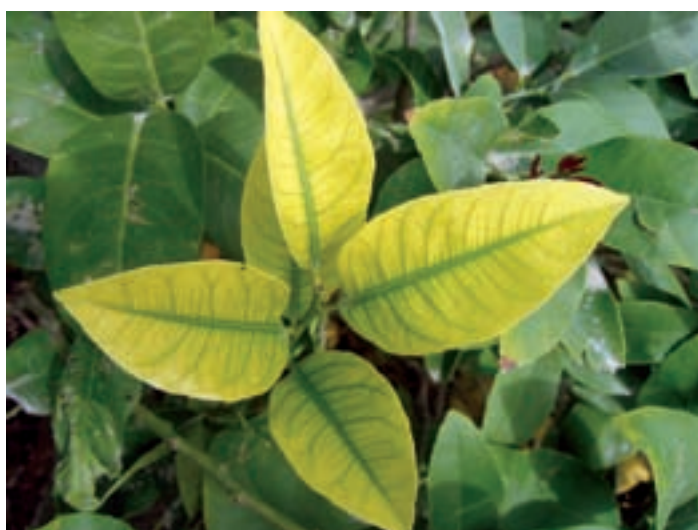
Hojas de limonero con la típica clorosis férrica. Esta carencia debe corregirse en primavera, mediante quelatos de hierro.

En cada riego, la duración de la fertilización deberá ser siempre la mayor posible, es decir, que si una instalación deber estar regando durante 4 horas, el tiempo de fertilización deberá ser alrededor de 3 horas y media, dejando un cuarto de hora al principio y otro cuarto de hora al final del riego para que salga agua solamente. En cualquier caso hay que asegurarse de que al final del riego no queden fertilizantes en las tuberías.