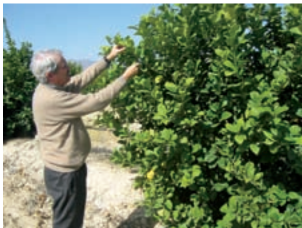
Un muestreo foliar anual y un análisis del contenido de nutrientes en las hojas, son la base de una equilibrada fertilización.