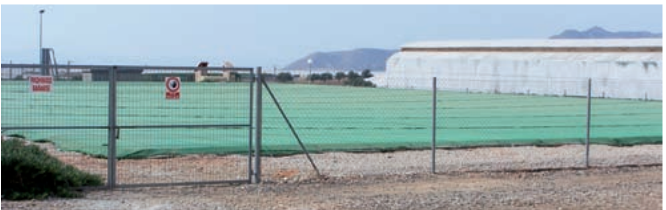
Cubrir los embalses minimiza las pérdidas de agua por evaporación y evita la proliferación de algas al obstaculizar el paso de la luz.