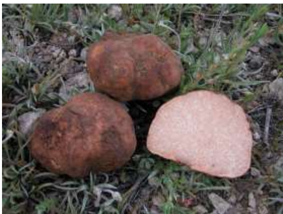
Foto1: Terfezia claveryi

Indicar Terfezia claveryi es una especie primaveral que crece en terrenos básicos, asociada a las raíces de Helianthemum spp. , que se distribuye por la zona este de la Península Ibérica, presenta carpóforos globosos de 2-12 cm de diámetro con forma de tubérculo y superficie pardo-rojiza. El interior es rosa pálido. Muestra un olor ligeramente fúngico, perfumado y agradable. El sabor recuerda sutilmente al de la avellana, con una textura compacta incluso crujiente, muy placentera en boca.