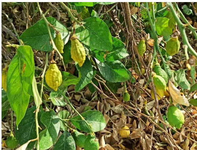
Figura 7: Apariencia de limones (arrugados y marchitos) en una infección súbita en rama de limonero. Fuente: Propia. Síntomas de la enfermedad en limones, con presencia de necrosis del pericarpio en el área del pedúnculo. Fuente: Propia.