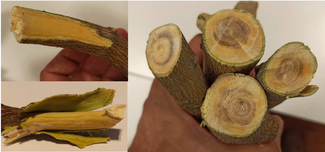
Figura 5: Detalle de ramitas y ramas más grandes con coloración anaranjada características y formación de anillos oscuros producidos por necrosis de tejidos conductores.