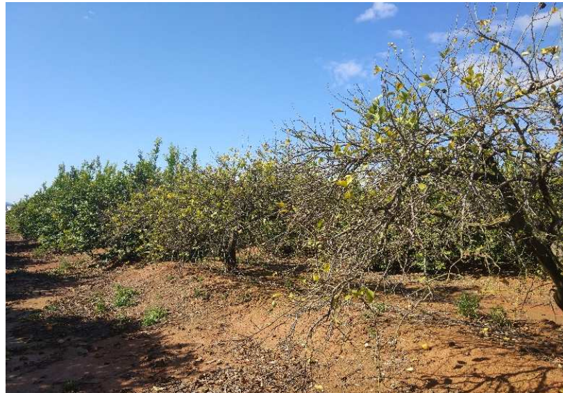
Figura 3: Plantación de limonero adulto afectado por gomosis y asfixia radicular consecuencia de la DANA del pasado otoño.