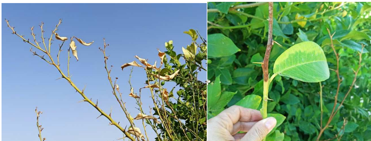
Figura 1: Primeros síntomas en ramas, con secado y caída de hojas aunque los peciolo permanecen adheridos a las ramas (izquierda). Detalle de ramita con inicio de infección, donde apreciamos clorosis en hoja y rama.