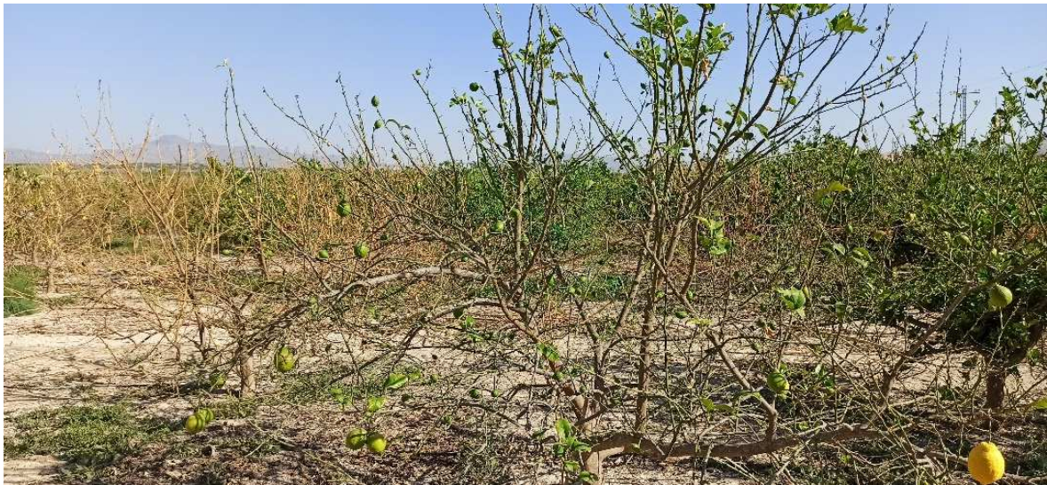
Figura 6: Panorámica de plantación donde se ha originado el brote, justo en la zona cero donde se encuentran numerosos árboles muertos.