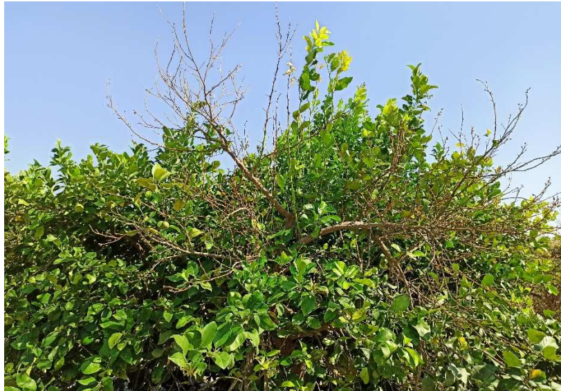
Figura 2: Detalle de limonero que muestra síntomas solamente en una rama principal, manteniendo una apariencia normal en el resto