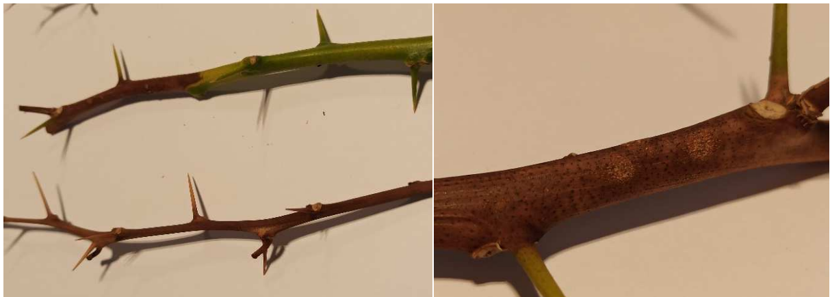
Figura 4: Detalle de ramas con inicio de infección. La zona de inserción de espinas se mantiene verde más tiempo que el resto dada la rapidez de la infección. Fuente: Propia.