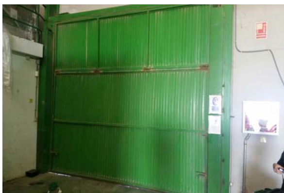
Foto 1. Puerta de apertura manual vertical

Puertas para uso comercial: Puertas instaladas en locales comerciales en áreas accesibles al público y cuyo principal objetivo es dar seguridad de acceso a mercancías y vehículos acompañados de personas, así como los cierres o persianas enrollables y rejas enrollables, que están destinados principalmente para el acceso de personas.