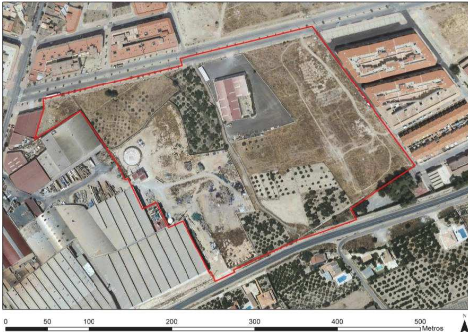
Imagen 2: Vista aérea del ámbito del Plan Parcial. 1:2000.

El Sector se caracteriza por poseer dos zonas diferenciadas y separadas por el Camino público de San Sebastián; la zona oeste o zona de campa o almacenaje de la empresa Cofrusa, y la zona este caracterizada principalmente por ser zonas de cultivos de cítricos abandonados o en explotación, además de la instalación de un supermercado (Cash Direct) con licencia provisional en el sector.