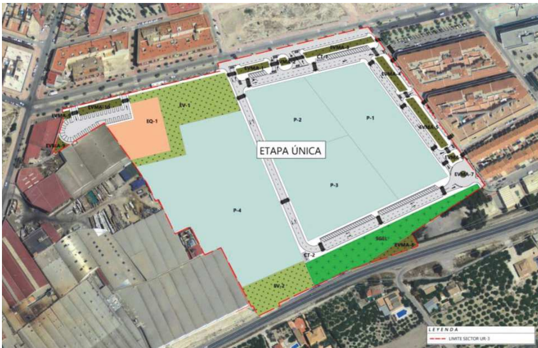
Imagen 4: Ordenación de la alternativa elegida.