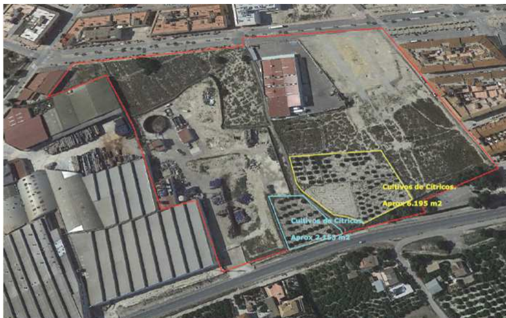
Imagen 3: Detalle de la delimitación zonas de cultivos de cítricos dentro del sector. Superficies de cultivo actual aproximadamente 2.153 m 2 y 6.195 m 2 .

El Sector se caracteriza por poseer dos zonas diferenciadas y separadas por el Camino público de San Sebastián; la zona oeste o zona de campa o almacenaje de la empresa Cofrusa, y la zona este caracterizada principalmente por ser zonas de cultivos de cítricos abandonados o en explotación, además de la instalación de un supermercado (Cash Direct) con licencia provisional en el sector.