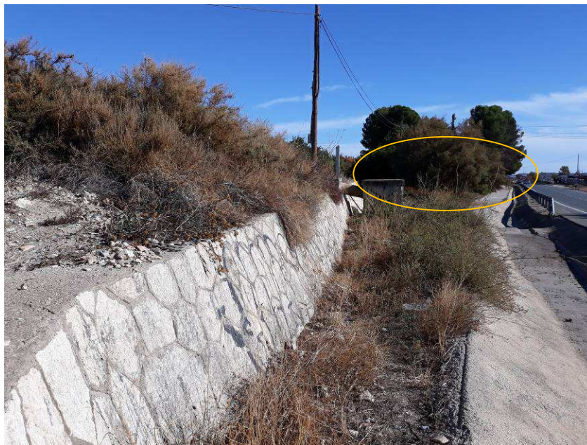
Imagen 7: Vista de E-1 Muro Estación de Mula y ejemplares de tarays a conservar por el Plan Parcial.

En cuanto al patrimonio cultural, el informe arqueológico realizado a petición de la Dirección General de Bienes Culturales, concluye que dentro de la zona no existen yacimientos arqueológicos, siendo el yacimiento más próximo el casco antiguo de Mula, situado a 600 m de la actuación, pese a que se ha documentado abundante cultura material, de los siglos XVIII-XIX y XX, y en el límite meridional del Plan Parcial un elemento o sitio etnográfico que corresponde a un muro de aterramiento ( E-1 Muro Estación Mula), el cual no se verá afectado al ser preservado por el Plan Parcial al igual que los ejemplares arbóreos ( tarays) que se encuentran en esta zona.