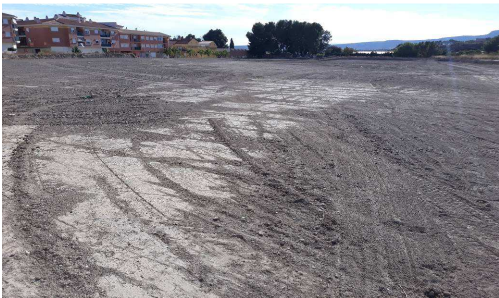
Imagen 5: Zona Este ámbito del Plan Parcial.

Con fecha 09 de noviembre de 2020, se realizó visita a la zona por parte del personal del Servicio de Información e Integración Ambiental con el fin de comprobar las características del terreno. En la visita de comprobación, se pudo corroborar la existencia de cultivos de cítricos abandonados y en producción, infraestructuras viarias ejecutadas cercanas al sector, un supermercado y varias naves. En dicha visita también se observó que en la zona este del ámbito del Plan Parcial, se han realizado movimientos de tierras y compactación del terreno en la que se ha eliminado toda vegetación; dichos movimientos de tierra se han realizado bajo la concesión de una licencia provisional por parte del Excmo. Ayuntamiento de Mula, de fecha de 22 de septiembre de 2020.