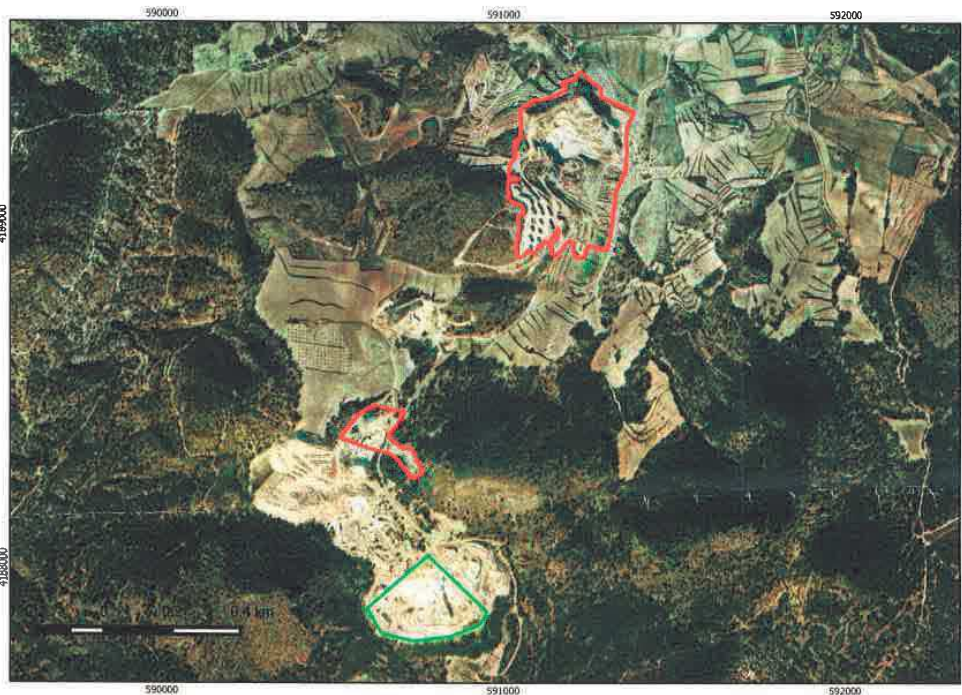
Plano Localización. En rojo las zonas propuestas por el Ayuntamiento de Lorca, y en verde lo solicitado por la empresa Canteras Alicantinas S.L.U.