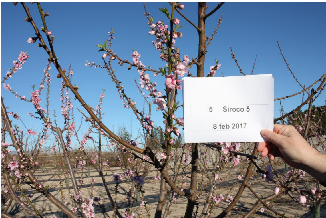
Foto nº 1. Floración de la variedad Siroco 5

La plantación se realizó con planta injertada, utilizando sistema de riego localizado a goteo con dos tuberías por fila, cubiertas por malla de suelo negra de 1,5 m, con el objetivo de ahorrar agua y evitar la utilización utilizar herbicidas.