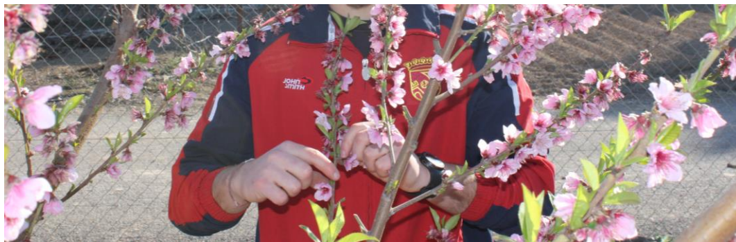
Foto nº 4. Aclareo de flores en melocotonero.

Como labor específica del cultivo de frutales extratempranos, está el clareo de flores, que es imprescindible en estas variedades que tiene un ciclo tan corto desde floración a recolección, y que por tanto para lograr un tamaño comercial hay que eliminar la mayor parte de los frutos. Además estas variedades de melocotón son autocompatibles con lo que se produce el cuajado de la mayoría de las flores.