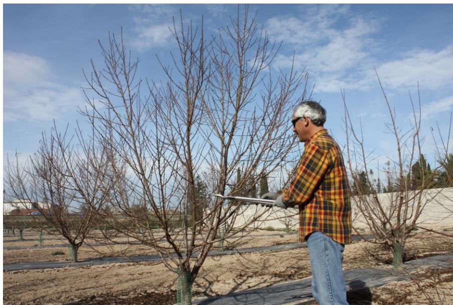
Foto nº 2. Poda de formación de los árboles en el segundo año desde la plantación.