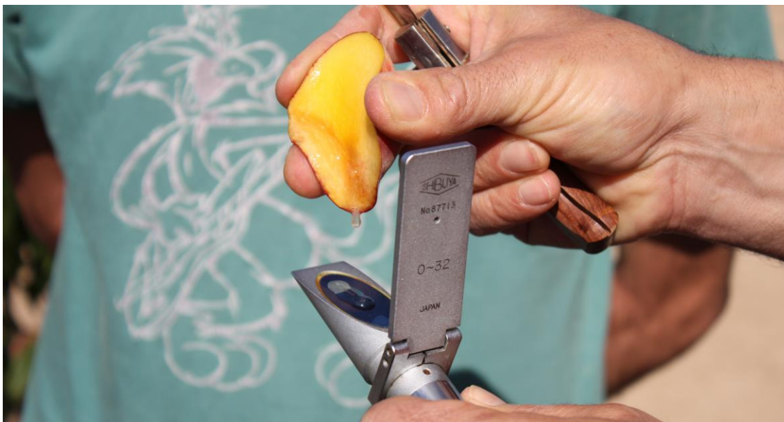
Foto nº 5. Medida de los grados Brix con refractómetro.