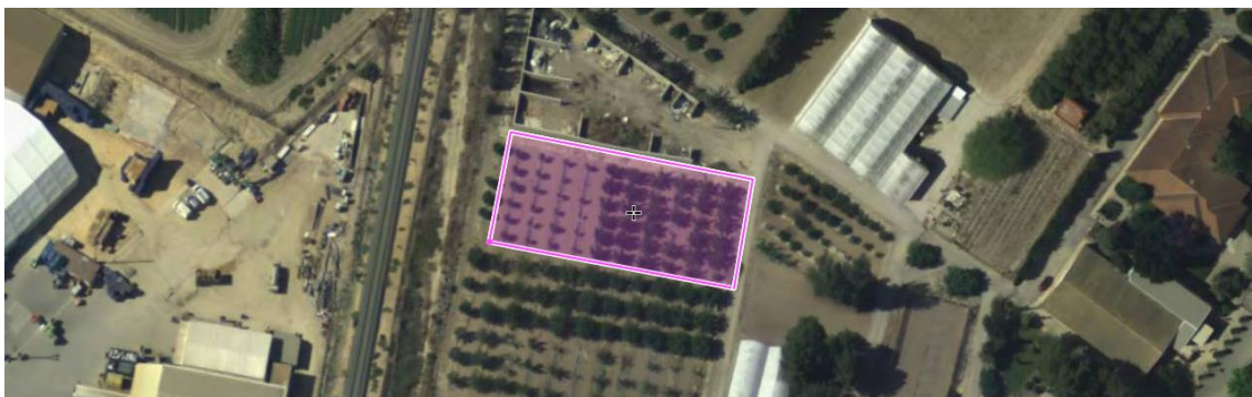
Figura nº 1. Ubicación del ensayo.

La superficie que ocupa el ensayo son unos 1700 m 2 , donde plantan 10 filas con un ancho de calle de 5,50 m. Cada fila de 25 metros de larga tiene 6 árboles separados 4 m de cada variedad.