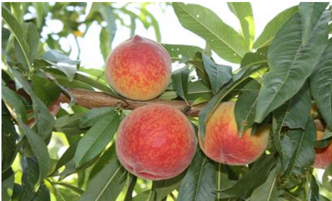
Foto nº 6. Melocotones a punto de ser recolectados, mayo 2017.

La recolección se realiza individualmente de cada árbol, controlándose el peso total de la fruta, el calibre medio, el grado brix y la consistencia, así como las características organolépticas y de apariencia como color de la piel y la pulpa