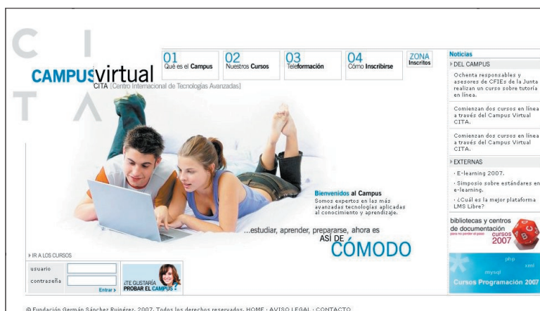
Figura 4.4. Ejemplo de uso de Moodle. En: http://www.fundaciongsr.es