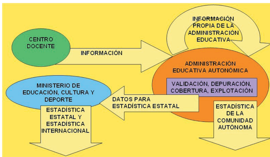
Figura 3.1. Flujo de información de la estadística educativa en SINEE.

(SINEE), que integra los procesos de captura de datos, validación-depuración de los mismos y explotación (para la comunidad autónoma 20 y para la Estadística Estatal). Este sistema aporta un punto común a partir del cual todas las administraciones educativas pueden desarrollar la estadística, favoreciendo la obtención de las estadísticas estatales de educación al normalizar los mecanismos de obtención.