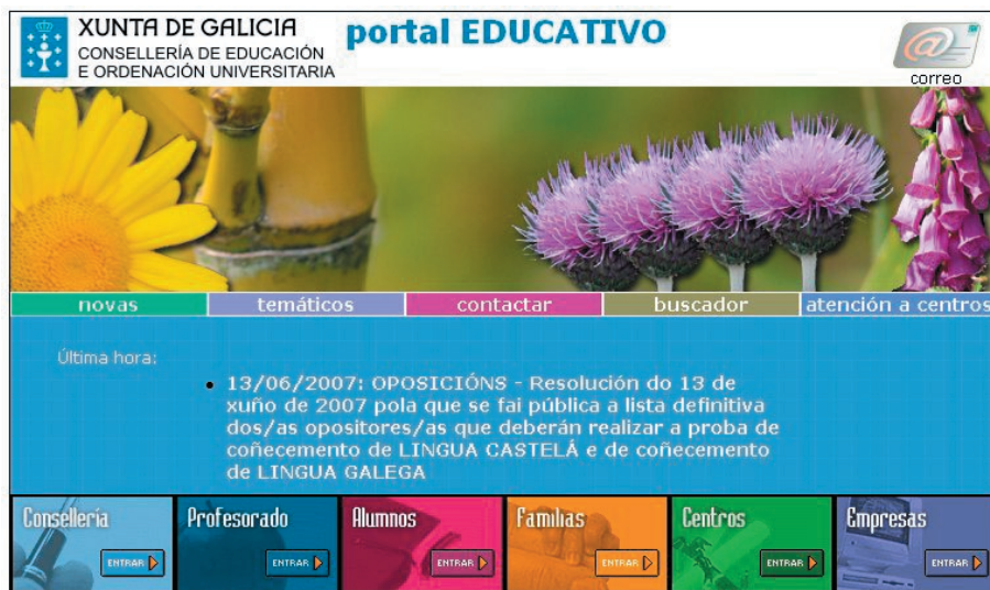
Figura 4.1. Página principal del portal educativo de la Xunta de Galicia.

Los portales educativos informativos son los más extendidos y dentro de este grupo se encuadran los portales institucionales que son aquellos sitios web de una institución, grupo, asociación o empresa relacionada con la Educación. Estos portales ofrecen información sobre actividades, noticias, organigrama, normativa, servicios o recursos, publicaciones, etc., en torno a la institución a la que representan, por ejemplo, el portal educativo de la Xunta de Galicia: