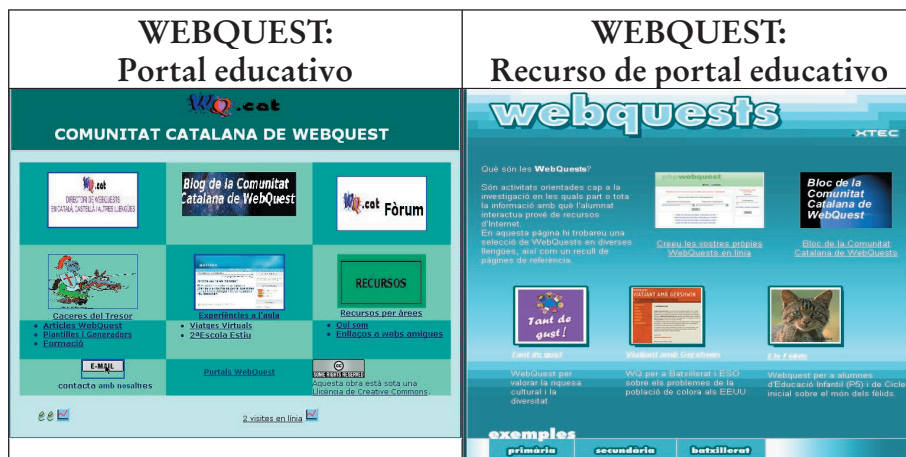
Figura 4.6. Ejemplos de portales educativos con servicio de webquest.

formación en la elaboración y alojamiento de webquets, etc., como por ejemplo la Comunidad Catalana de Webquest, o por otra parte, pueden estar integrados como recursos en el seno de portales educativos institucionales, como es el caso de la Xarxa Telemàtica Educativa de Catalunya (.XTEC).