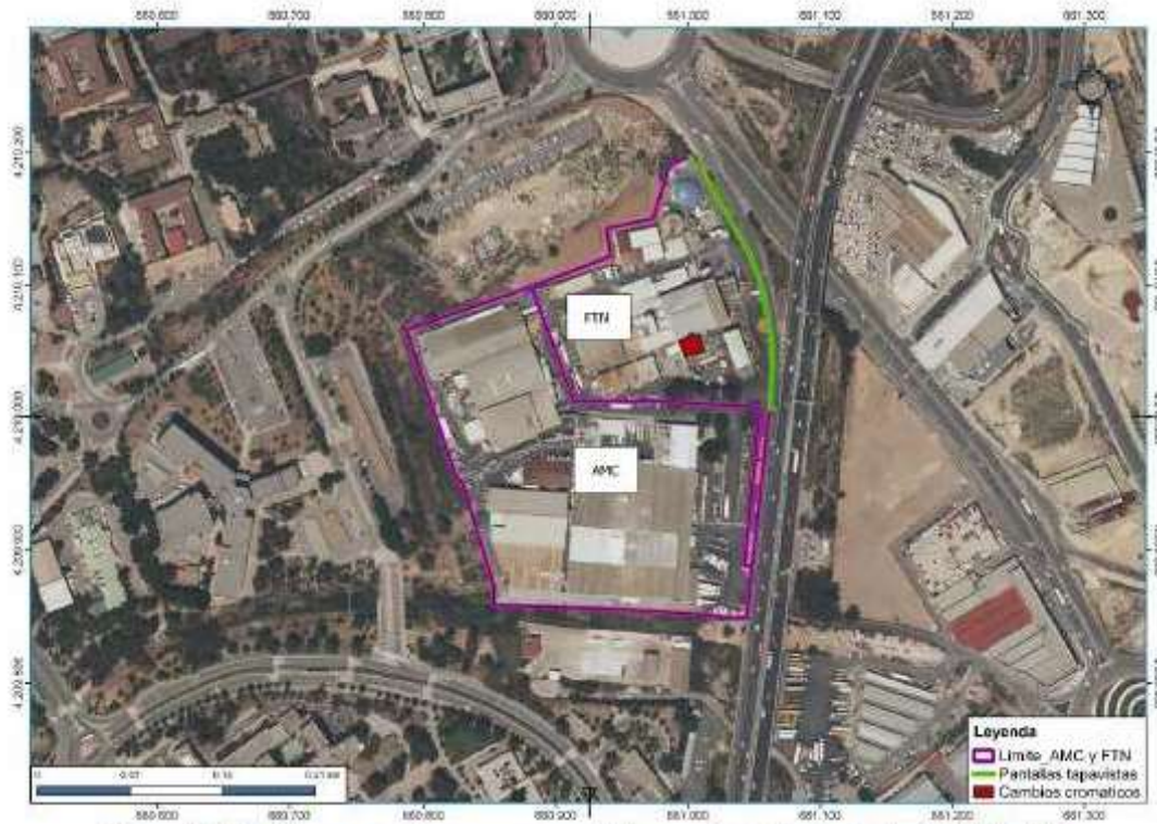
Figura 40. Medidas preventivas y compensatorias en el establecimiento de FTN y AMC

El resultado de la implementación de estas medidas, puede observarse en la figura que se presenta a continuación: